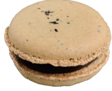
Nanatea ナナティエ ¥308

当店の名前がついたこちらの商品は、なんと烏龍茶風味。甘さ控えめな香ばしさが何度も口に運びたくなります。