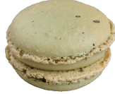
Jasmine ジャスマン ¥308

当店の名前がついたこちらの商品は、なんと烏龍茶風味。甘さ控えめな香ばしさが何度も口に運びたくなります。