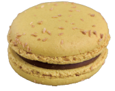
Passion パシオン ¥308

マダガスカル産バニラを贅沢に使用したこちらは、一口頬張るだけで至福のひと時を味わえます。