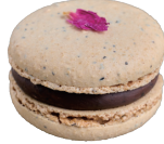
Earl Grey アールグレイ ¥308

高級ジャスミン茶葉を生地とクリームに使用。ジャスミンミルクティーをイメージして作られた香り高い一品。