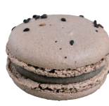
Sesam セザム ¥308

最高級チョコレートブランド、ヴァローナ社のハイカカオチョコレートを使用した贅沢な一品。