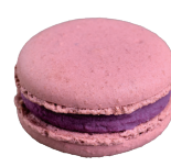
Cassis カシス ¥308

フルーティで甘酸っぱいカシスのクリーム。バイオレットカラーが可愛いさっぱりとしたマカロンです。