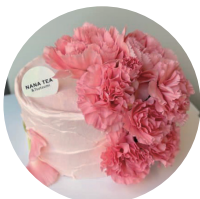
飾りお花イメージ