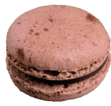
Chocolate ショコラ ¥308

フランボワーズのガナッシュにグロゼイユ、カシス、フリーズデボワのコンフィチュール。当店人気のドリンクをマカロンにアレンジ。