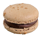
Pralines ブラリネ ¥308

フルーティで甘酸っぱいカシスのクリーム。バイオレットカラーが可愛いさっぱりとしたマカロンです。