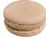
Vanille パニーユ ¥308

ふんだんに生地に練り込んだベルガモット香る茶葉と、濃く煮出したクリームが贅沢な一品。