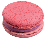
Berry berry ベリーベリー ¥308

フランボワーズのガナッシュにグロゼイユ、カシス、フリーズデボワのコンフィチュール。当店人気のドリンクをマカロンにアレンジ。