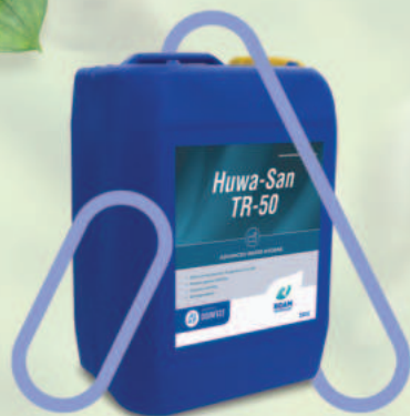
HUWA - SAN TR-50