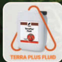
TERRA PLUS FLUID