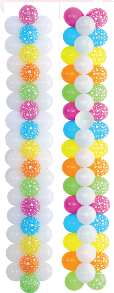
Vista Lateral 1