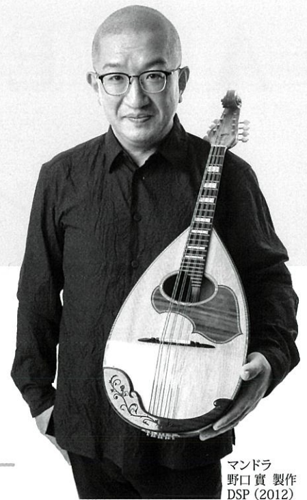
マンドラ 野口 實 製作 DSP (2012)

マンドリンと同様にピックを用いて「トレモロ」を中心に演奏するが、時には「人(男性)の声のよう」と称されることも多い。