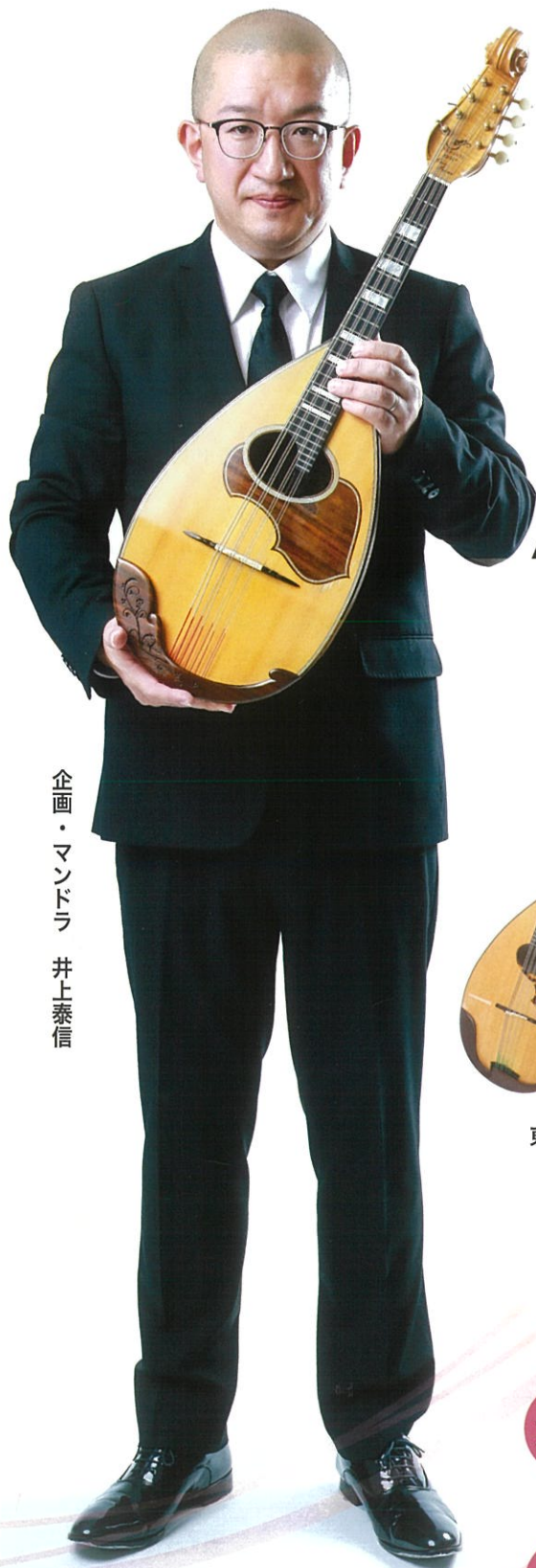
企画・マンドラ 井上泰信