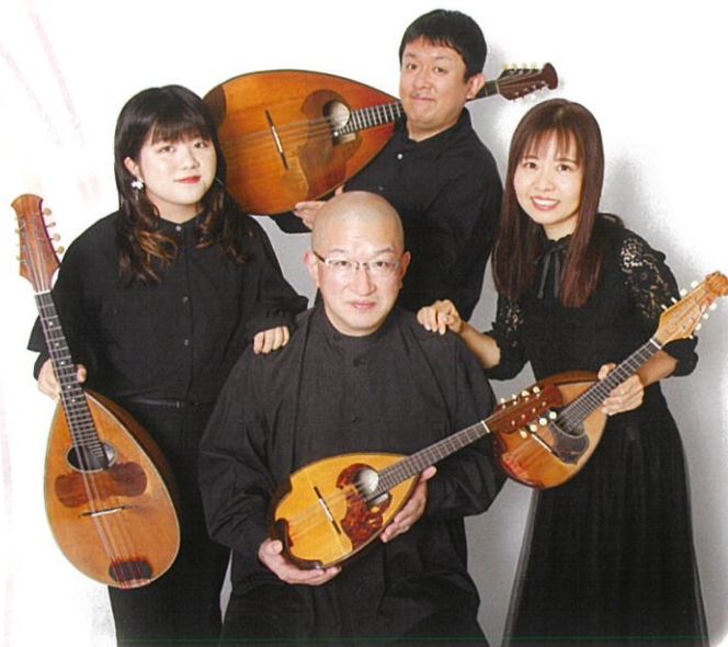
大阪公演 ARSNOVA Mandolin Quartet