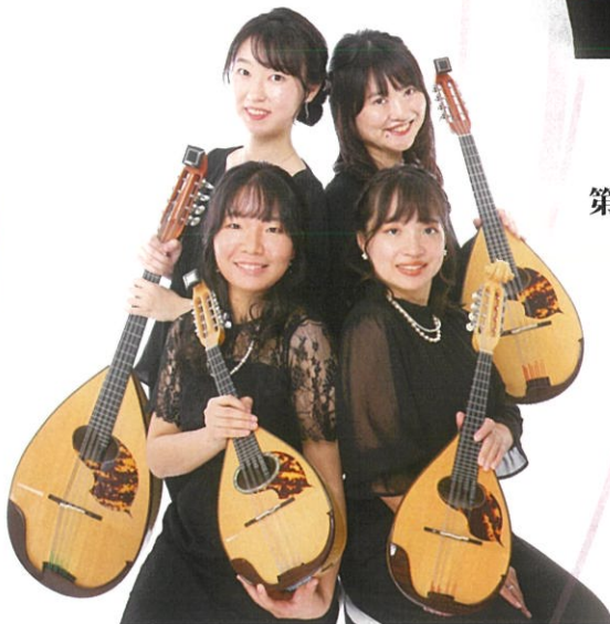
東京公演 ARTE TOKYO Mandolin Quartet