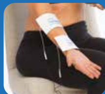
Elleboog en onderarm