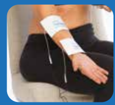
Elbows and forearms