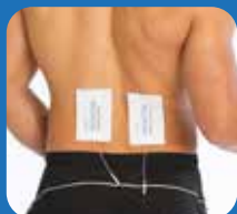
Долната част на гърба