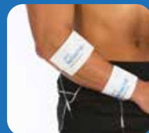
Elleboog en onderarm