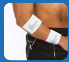
Elbows and forearms