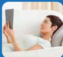
Nek en schouders