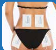
Долната част на гърба и седалищни мускули