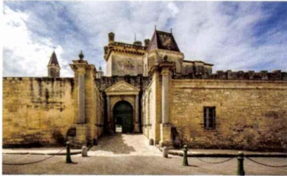
LE CHÂTEAU DUCAL.