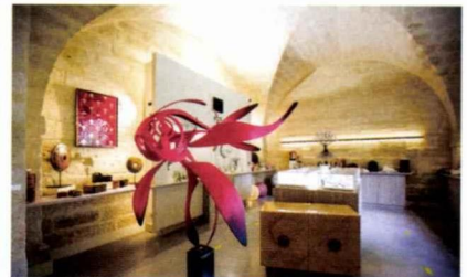
MAISON DES ARTISANS D'ART.