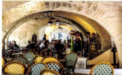
LE CAFÉ DE L'OUSTAL.