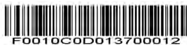
コード 11 - 任意の長さ

このオプションをスキャンして、スキャンエンジン機能内の任意の数の文字を含むコード 11 シンボルをデコードします。