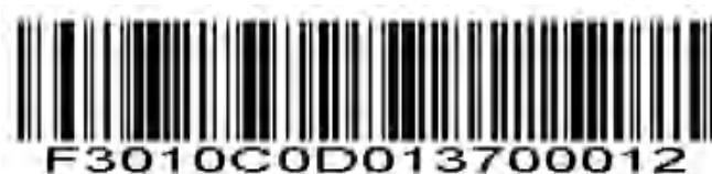
コード 11-範囲内の長さ

特定の長さ範囲のコード 11 シンボルをデコードするには、このオプションを選択します。付録の数値バーコードを使用して長さを選択します。たとえば、4~12文字を含むコード 11 シンボルをデコードするには、最初に コード 11-範囲内の長さ をスキャンします。次に、 0、4、1、および 2 をスキャンします（1桁の数字の前には常に先行ゼロを付ける必要があります）。エラーを修正したり、選択を変更したりするには、付録の Cancel をスキャンしてください。