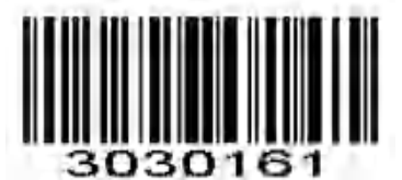
* EAN-13 チェック文字を送信する