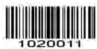
EAN-8 ゼロ拡張を有効にする

EAN-8ゼロ拡張を有効にする: EAN-8バーコードをデコードして13桁に拡張するには、先行ゼロを5つ追加します。