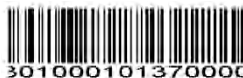
コード 39-範囲内の長さ

このオプションは、デコードを指定された範囲内のコード 39 シンボルのみに制限します。たとえば、4~12文字を含むコード 39 シンボルをデコードするには、最初にコード 39-範囲内の長さをスキャンします。次に、付録の数値バーコードに従って 0、4、1、および 2 をスキャンします。選択を変更したり、間違っただエントリをキャンセルしたりするには、付録の Cancel をスキャンしてください。