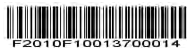
MSI - 2 つの個別の長さ

選択した 2 つの長さを含むコードのみをデコードするには、このオプションを選択します。たとえば、MSI Plessey の 2 つの個別の長さを選択し、0、6、1、4 をスキャンして、6 文字または 14 文字を含む MSI Plessey シンボルのみをデコードします。数値バーコードは付録にあります。選択を変更したり、間違ったエントリをキャンセルしたりするには、付録の Cancel をスキャンしてください。