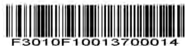
MSI - 範囲内の長さ

指定した範囲内のコードをデコードするには、このオプションを選択します。たとえば、4~12 文字を含む MSI シンボルをデコードするには、最初に範囲内の MSI 長をスキャンし、次に 0、4、1、および 2 をスキャンします（1桁の数字の前には常に先行ゼロを付ける必要があります）。数値バーコードは付録にあります。選択を変更したり、間違ったエントリをキャンセルしたりするには、付録の Cancel をスキャンしてください。