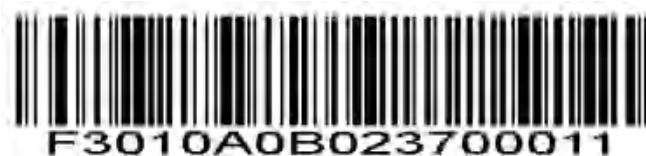
コード 93-範囲内の長さ

このオプションは、指定された範囲内のコードタイプをデコードするようにユニットを設定します。たとえば、4~12 文字を含むコード 93 シンボルをデコードするには、最初に コード 93 範囲内の長さ をスキャンし、次に 0、4、1、2 をスキャンします（1桁の数字の前には常に先行ゼロを付ける必要があります）。数値バーコードは付録にあります。選択を変更したり、間違ったエントリをキャンセルしたりするには、付録の Cancel をスキャンしてください。