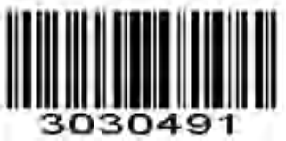
D 2of5 チェックディジットを送信する (有効)