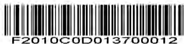
コード 11-2つの個別の長さ

選択した2つの長さのいずれかを含むコード 11 シンボルのみをデコードするには、このオプションを選択します。付録の数値バーコードを使用して長さを選択します。たとえば、2文字または14文字を含むコード 11 シンボルのみをデコードするには、 コード 11-2つの個別の長さ を選択し、 0、2、1、4 の順にスキャンします。エラーを修正したり、選択を変更したりするには、付録の Cancel をスキャンしてください。