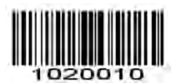
*EAN-8 ゼロ拡張を無効にする