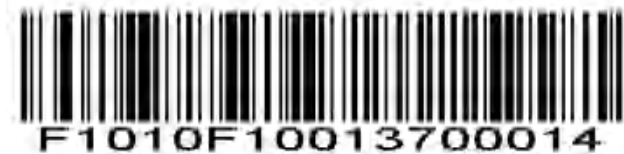
MSI - 1 つの個別の長さ

選択した長さを含むコードのみをデコードするには、このオプションを選択します。たとえば、MSI Plessey を 1 つの離散長として選択し、1、4 をスキャンして、14 文字を含む MSI Plessey シンボルのみをデコードします。数値バーコードは付録にあります。