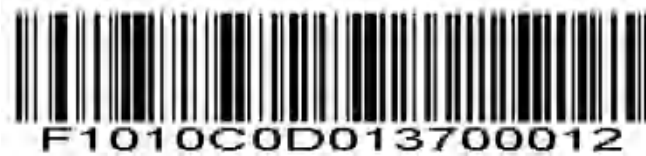
コード11 - 1つのディスクリート長

キャンします。エラーを修正するか、選択を変更するには、付録の Cancel をスキャンします。