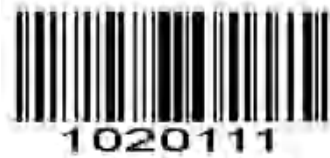
コード 39 フル ASCII 有効化

コード 39 Full ASCII は、コード 39 の変形であり、文字をペアにして完全な ASCII 文字セットをエンコードします。