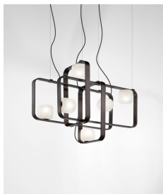
GROOV SP 4