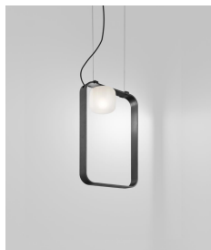
GROOV SP 60