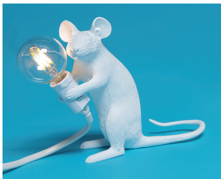
- MAC -