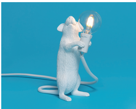
- STEP -