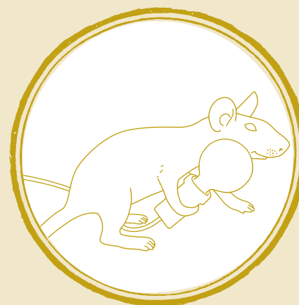
- LOP -

Le immagini riportate sono puramente indicative e possono differire dal prodotto effettivo - The images shown are indicative and may differ from the actual product - Les images présentées sont seulement à titre indicatif et peuvent différer du produit réel - Die Bilder dienen nur der Illustration und können von den tatsächlichen Produkten abweichen - Las imágenes son puramente orientativas y pueden no coincidir con el producto efectivo