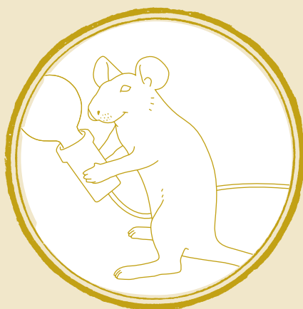
- MAC -