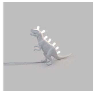
ART. 14763 - TREX

Zタイプの接続について、本照明器具の外付けフレキシブルケーブルやコードを交換することはできません。コードが破損した場合は、照明機器を解体処分する必要があります。