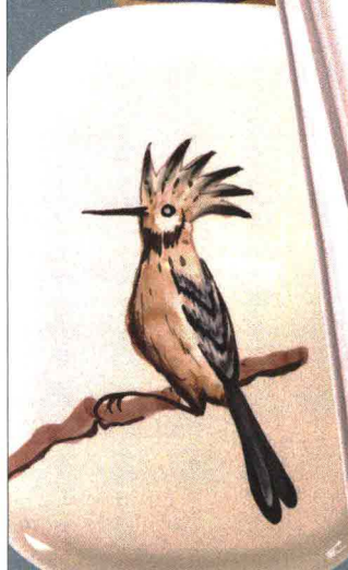
Vassoio di ceramica VIRGINIA CASA.

Marsala Superiore Riserva Donna Franca CANTINE FLORIO 40 euro.