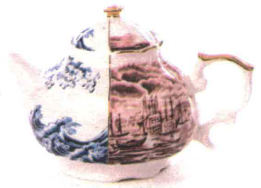
TEIERA Smeraldina coll. Hybrid [Seletti € 99].