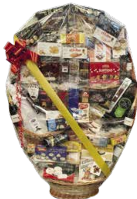
Muestra únicamente de presentación de la Cesta XXL, no de productos