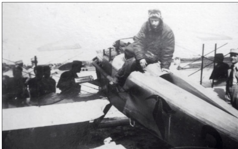
ARMÉE DE L'AIR

dossé les cocardes depuis cet ouvrage qui fit référence à l'époque. En conservant le même esprit, le Centre d'études stratégiques aérospatiales (Cesa) propose une nouvelle grande histoire de l'armée de l'Air et de l'Espace. Cette mise à