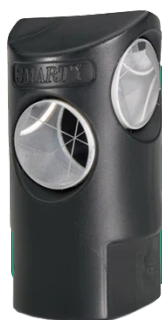
Smarty 5 med 5 prismon