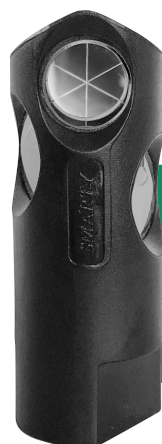
Smarty 6 med 6 prismon