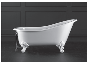
Bath shown with optional K50 waste kit