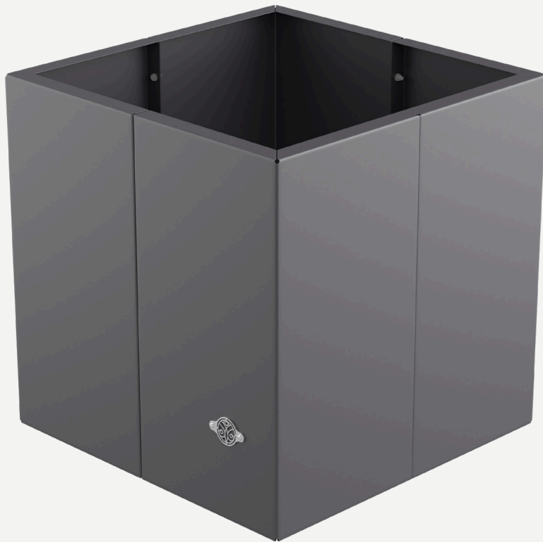
Pflanzkübel Vernazza Metall und Cortenstahl