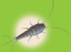
Pececillo de Plata