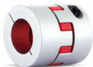
サイドカットが無い省スペース型クランプタイプ