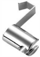
Crochet pour douchette