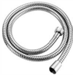
Tuyau de bidet en métal