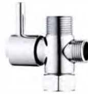
Adaptateur en T avec valve de fermeture