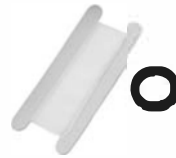
Ruban de plombier, Joints