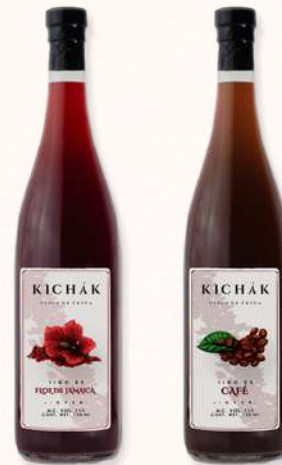
VINOS DE FLORES Y GRANOS