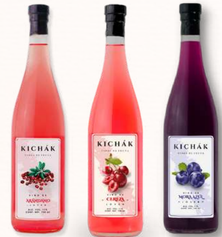
VINOS DE BAYAS