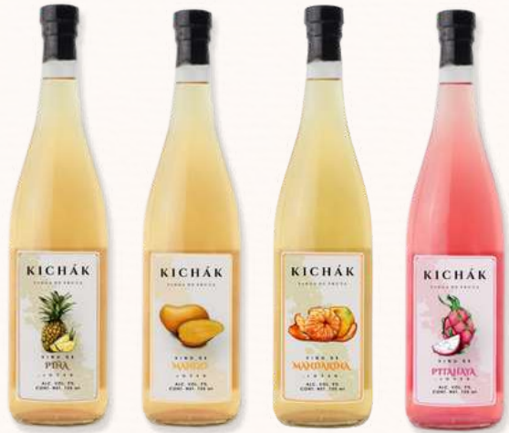
VINOS DE FRUTAS TROPICALES