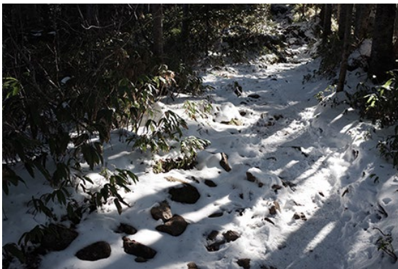
Custom Image mode FUYUNO