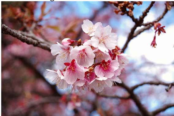
Custom Image mode HARUBENI