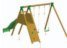
Baloioço duplo com escorrega e escalada