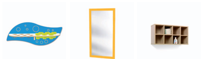
Prateleira de casa de banho para copos

Neste espaço devem ser desenvolvidas todas as rotinas de higiene, promovendo a autonomia progressiva de cada criança e a interiorização das regras básicas de higiene pessoal.