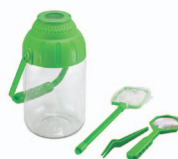
Conjunto de exploração da natureza

Esta área possibilita a realização de diferentes atividades experimentais e a aquisição de novos conhecimentos de forma desafiadora e motivadora, suscitando o interesse pela área das ciências.