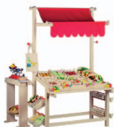
Tenda de mercado