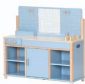
Bancada de carpinteiro