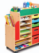
Armário para artes