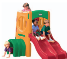
Ginásio com escorrega duplo