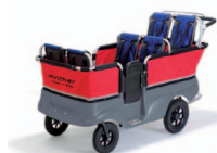
Autocarro 6 crianças