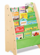
Estante para livros