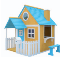
Casinha de atividades com terraço