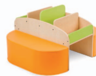
Contentor com puff's