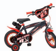
Bicicletas com pedais