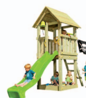
Torre com escorrega, escadas e areia