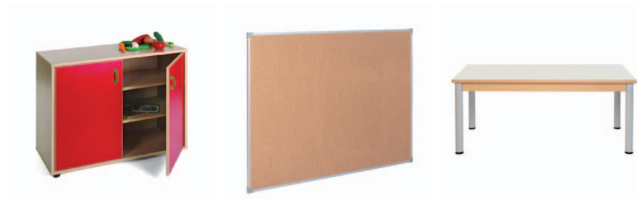
Armário Linha NE tamanho S fechado

Esta área é reservada aos/às educadores/as. Destina-se à organização de materiais e recursos de apoio ao processo de promoção do bem-estar e desenvolvimento das crianças.