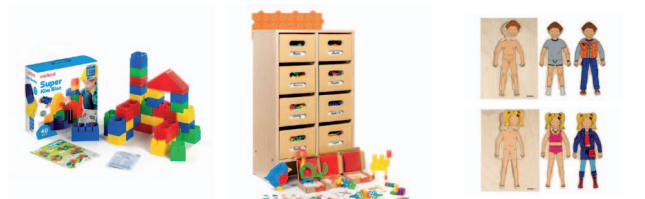
Blocos Kim bloc

Esta zona deve possuir recursos que permitam à criança explorar não só interações sociais e conceitos de construção como também desenvolver o pensamento, a motricidade fina e a autonomia.