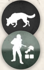
29 pions renfort ennemi