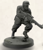
Ennemis d'élite pour Secret Weapons (5 parachutistes et 5 Goliaths)