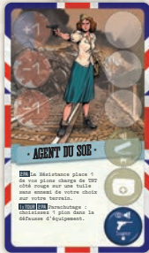
6 cartes commando (nouvelle illustration)