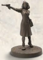
1 Agent du SOE