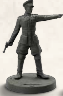
Ennemis d'élite pour Résistance (5 officiers et 5 bergers allemands)