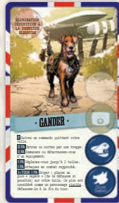
1 carte Gander (nouvelle illustration)