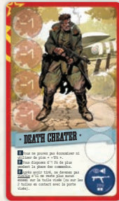
1 carte Death Cheater (nouvelle illustration)