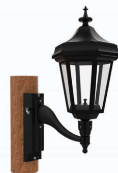
Montage sur poteau en bois Z