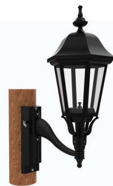
Montage sur poteau en bois Z