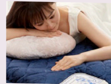
厚生労働省の認可を受けた 『電位・温熱組み合わせ 家庭用医療機器』