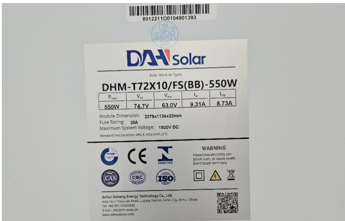
Abbildung 2: Photovoltaik-Modul (DHM-T72X10/FS(BB)-550W), 16 Stück gleichen Typs wurden eingesetzt

Es wurden 16 typgleiche Module in Prüfaufbau verwendet.