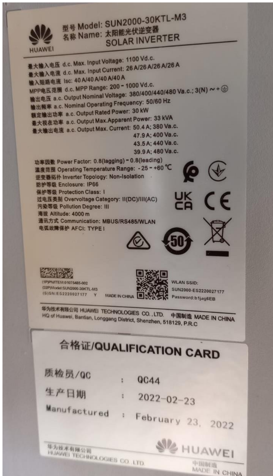
Abbildung 4: Wechselrichter 30 kW (SUN2000-30KTL-M3)