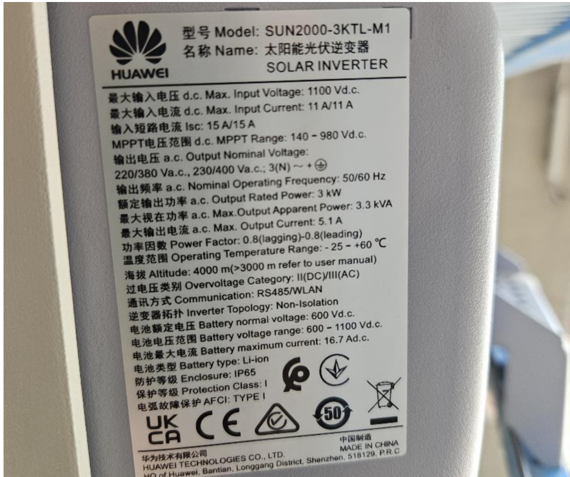
Abbildung 3: Wechselrichter 3 kW (SUN2000-3KTL-M1)