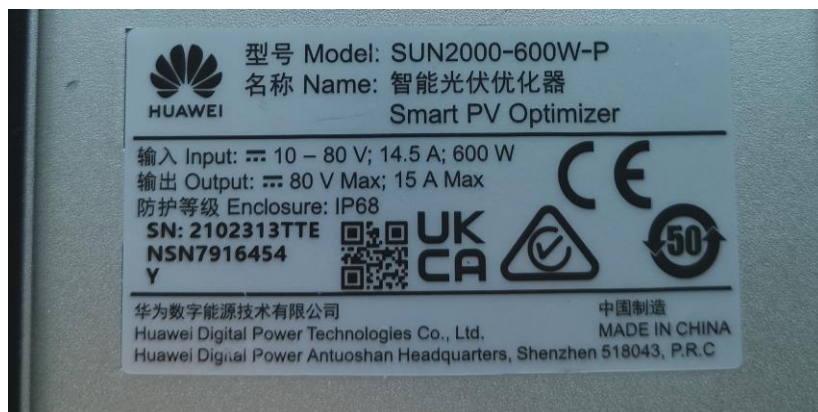
Abbildung 6: SUN2000-600W-P Smart PV-Optimierer