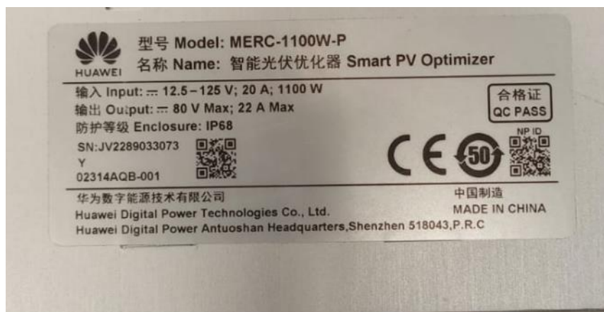
Abbildung 7: MERC-1100W-P Smart PV-Optimierer