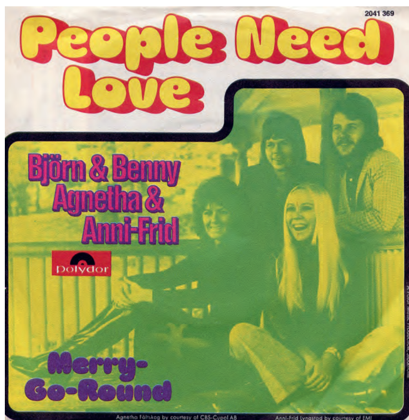
1972 erschien People Need Love, das die Gruppe dem deutschen Publikum erstmalig in der »Disco« vorgestellt hatte.

Benny hatte bereits 1969 seine Gruppe Hep Stars verlassen, mit der er in den 60er-Jahren zu einer der erfolgreichsten Gruppen in seiner Heimat gehörte, und vertiefte seine Zusammenarbeit mit Björn bei Polar Music. Anni-Frid trat in verschiedenen Revuen auf und veröffentlichte bei EMI ihre Platten, nachdem sie 1967 einen Talentwettbewerb gewonnen hatte und daraufhin zu Hylands hörna , einem der damals erfolgreichsten TV-Programme, eingeladen wurde, was ihr zum Durchbruch in Schweden verhalf. Agnetha komponierte eigene Lieder, hatte bereits mit 17 Jahren einen Nummer-eins-Hit, veröffentlichte sehr erfolgreich Platten und spielte 1972 im Musical Jesus Christ Superstar die Hauptrolle der Maria Magdalena. Anfangs glich die Zusammenarbeit der vier noch einem Experiment, dem sie sich jedoch mit Freude und Begeisterung widmeten, denn sie wollten sehen, wie weit sie es gemeinsam bringen könnten. In ihrem Heimatland Schweden erreichte People Need Love 1972 immerhin Platz 17 und in den USA Platz 115 der Charts.