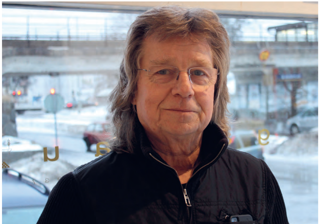
Die schwedische Gitarrenlegende Janne Schaffer war von Anfang an bei beinahe allen ABBA-Studioaufnahmen dabei.

Doch zum Glück verlief alles glatt und das Publikum belohnte den frischen und temperamentvollen Auftritt mit viel Applaus. Dennoch reichte es 1973 nicht zum Sieg, weil das Expertenteam sich für einen anderen Beitrag entschieden hatte, was wiederum Stig auf die Palme trieb. Er forderte vehement, zukünftig nur noch die Zuschauer entscheiden zu lassen, sollte sein Team überhaupt nochmals eine Teilnahme erwägen. Doch man hatte das Publikum vollkommen auf seiner Seite, und kurz nach Erscheinen der Single und des Albums mit dem gleichnamigen Titel waren sie mit der schwedischen Single auf Platz eins, die englische dahinter auf Platz zwei und das Album auf Platz drei! ABBA als Gruppenname existierte bei Veröffentlichung ihrer allerersten LP noch nicht, und daher standen auf dem Plattencover ihre Vornamen unter dem Albumtitel. Die Platte war eine Mischung aus vorwiegend neuen, aber auch älteren Songs, da Benny und Björn weiterhin andere Künstler produzierten und nicht die Zeit aufbringen konnten, die sie für mehr neues Material benötigt hätten. Aber auch Agnetha, die selbst viel komponierte, hatte einen Song geschrieben, zu dem Björn einen englischen Text verfasste: Disillusion . Einige Jahre später nahm sie dieses Lied für ihr Soloalbum in Schwedisch auf –