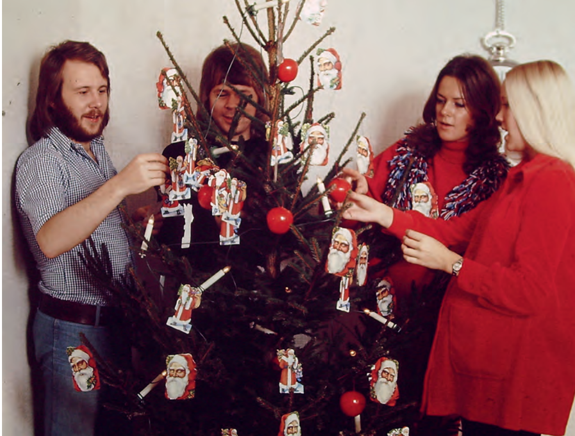
ABBAs Weihnachtsbilder wurden 1972 daheim bei Anni-Frid und Benny im Stockholmer Vorort Vallentuna aufgenommen. Agnetha war zwar sichtbar schwanger, aber der Fotograf bat sie dennoch, mit einem Kissen den Bauch größer aussehen zu lassen, da die Bilder erst zu Weihnachten veröffentlicht werden sollten.