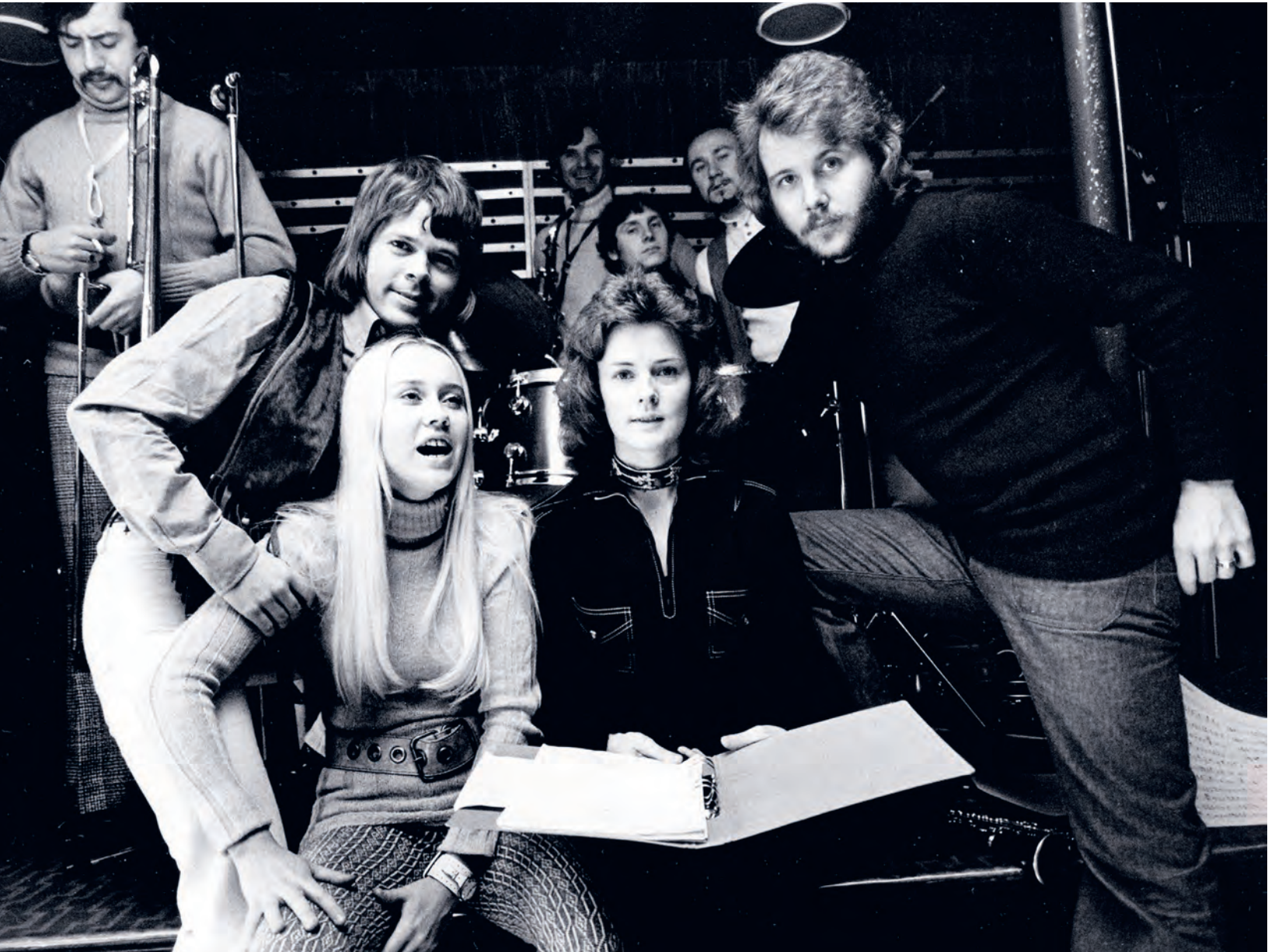
Anni-Frid, Benny, Björn und Agnetha 1970 bei den Proben für einen ihrer ersten gemeinsamen – nicht sehr erfolgreichen – Auftritte als Quartett unter dem Namen »Festfolk«.

sich unter anderem an dem amerikanisch-englischen Act Blue Mink und Middle of the Road. Zwar haben ABBA später im Verlauf ihrer langen Karriere eine Reihe von melancholisch-traurigen Liedern aufgenommen, aber ihre Karriere begannen sie mit einem freudigen, eingängigen Song über Menschen, die schlicht und einfach Liebe brauchen.