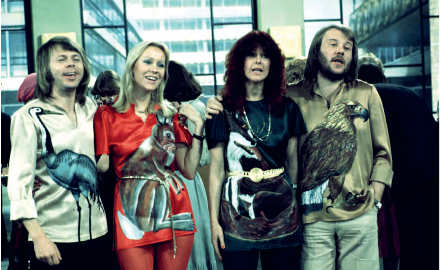
ABBA in Bremen, wo die Gruppe am 18. Februar 1978 bei Rudi Carrell in ›Am Laufenden Band‹ auftrat.