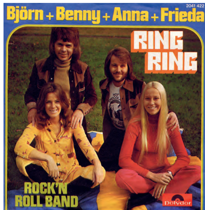
Ring Ring kam in einigen europäischen Ländern gut an, aber in Deutschland war es kein nennenswerter Erfolg.

In Deutschland wurde die Single zwar kein Hit, aber man war sich der Möglichkeiten hierzulande bewusst, weil Deutschland eines der größten und wichtigsten Absatzgebiete in Europa darstellte. Mit seinen knapp 62 Millionen Bundesbürgern, von denen ungefähr 30 Prozent unter 20 Jahren waren, war die BRD ein attraktiver Markt, der in den 70ern genauso vielfältig wie der Musikgeschmack seiner Bundesbürger selbst war: Schlager, Rock, Pop, Punk, Jazz, avantgardistische Musik und deutsche Liedermacher existierten mit- und nebeneinander. So hatten zum Beispiel die Rolling Stones, Pink Floyd, Deep Purple, AC/DC, Santana, Chicago, Roxy Music, David Bowie, Sweet, Salde, Suzie Quatro, Bee Gees, Earth Wind & Fire, Reinhard Mey, Wolf Biermann, Udo Lindenberg, Boney M., Donna Summer, Chris Roberts, Udo Jürgens, Peter Maffay, Cindy & Bert, Kraftwerk und Genesis bei ihren jungen und älteren Anhängern eine treue Käuferschaft. Was für eine musikalische Orientierungslosigkeit, aber zugleich auch Vielfältigkeit, die die BRD damals mit ihren verschiedenen Genres kennzeichnete! In Westdeutschland stieg das Realeinkommen, das zu einer erheblichen Wohlstandssteigerung in der Bevölkerung führte und sich auch auf das Konsumverhalten – und damit die Plattenverkäufe – positiv auswirkte. Eine LP kostete um die 20 D-Mark und eine Single 6 D-Mark. Viele Jugendliche, deren Musikgeschmack ebenso durch die umfangreiche musikalische Bandbreite zahlreicher Radiosender bedient wurde, kauften verstärkt Singles und