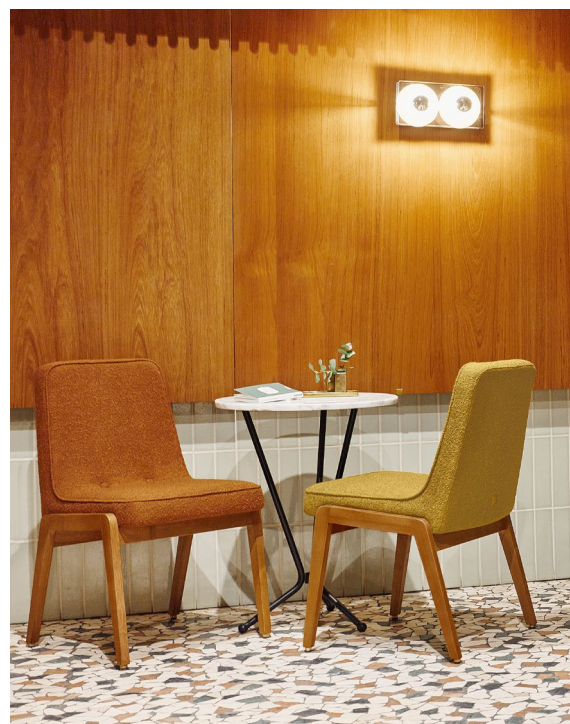
200-125 VAR Chairs / Chaises – Boucle Coll. / Mustard & Sierra