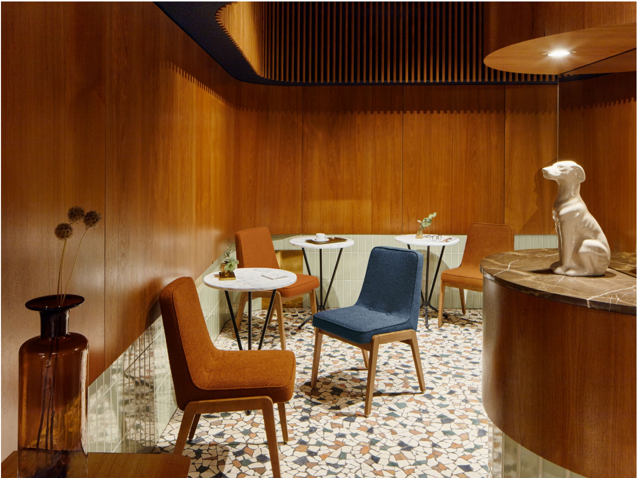
200-125 VAR Chairs / Chaises – Boucle Coll. / Denim & Sierra