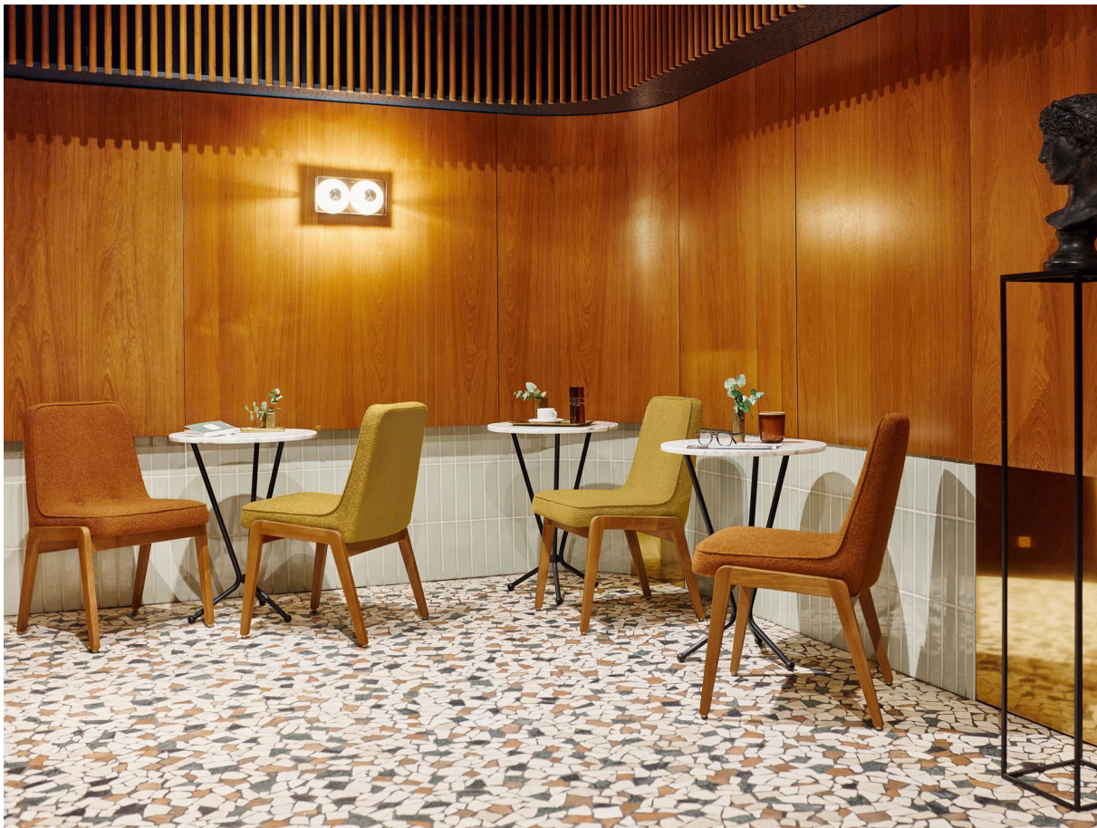
200-125 VAR Chairs / Chaises – Boucle Coll. / Mustard & Sierra