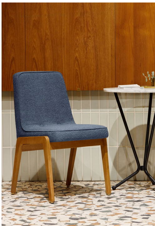
200-125 VAR Chair / Chaise – Boucle Coll. / Denim