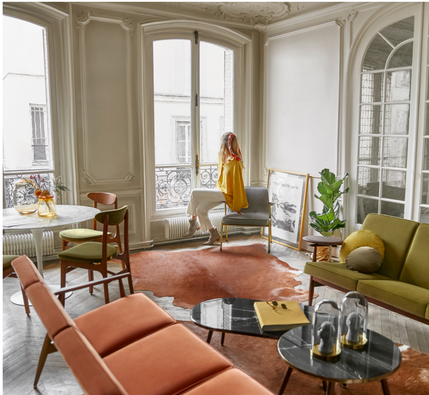
Amelia's sitting on 366 Metal Armchair / Fauteuil – Tweed Coll. / White