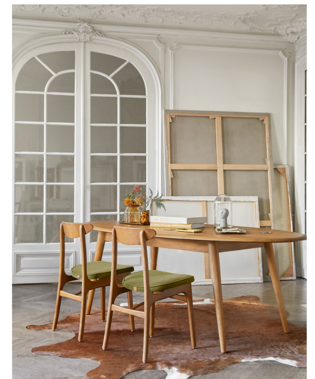
200-190 Chairs / Chaises – Velvet Coll. / Olive