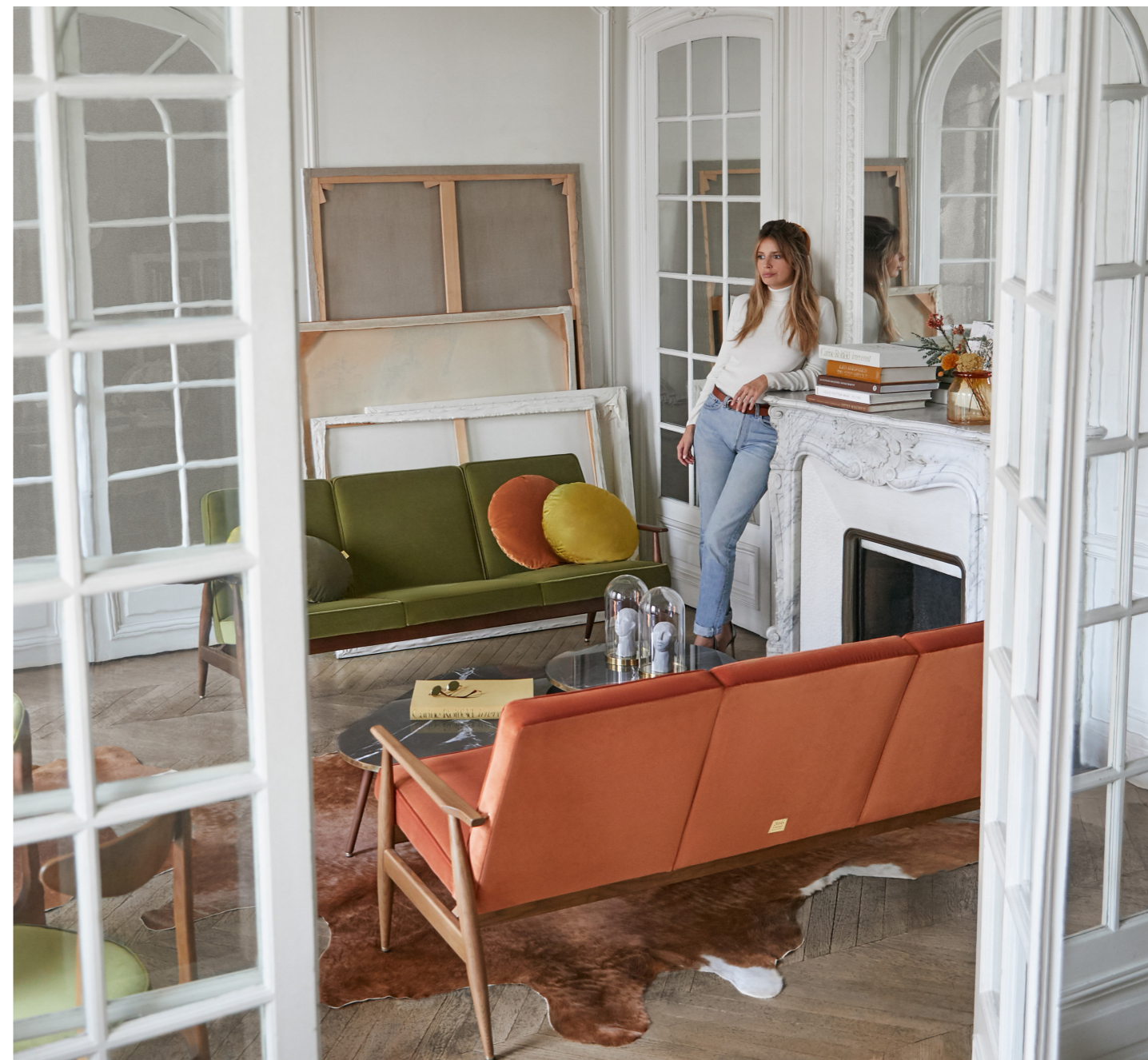
Fox 3-Seater / 3 Places – Velvet Coll. / Olive & Sierra

“Paris is always good idea.” – Audrey Hepburn “Paris, c’est toujours une bonne idée.”