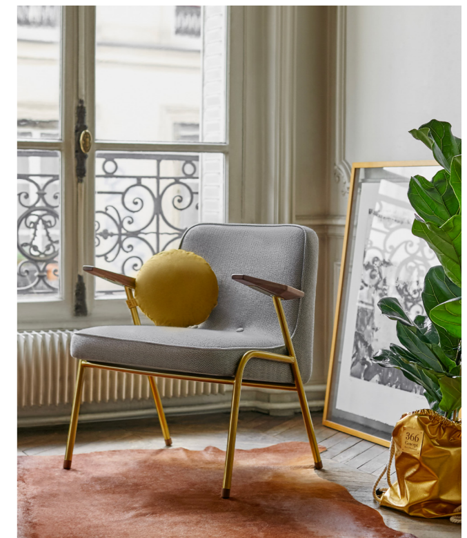
366 Metal Armchair / Fauteuil – Tweed Coll. / White

The Earth tones will warm up the interior!