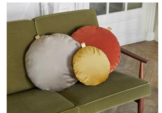
Circle Cushions / Rond Coussins – Shine Velvet Coll. / Mouse Grey & Mustard, Velvet Coll. / Sierra

Les couleurs naturelles vont réchauffer votre intérieur !