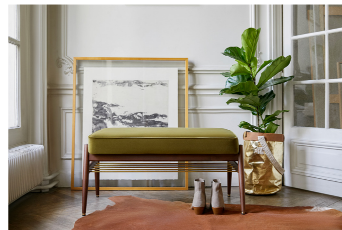
Fox Bench 90 / Banquette 90 – Velvet Coll. / Olive

Les couleurs naturelles vont réchauffer votre intérieur !