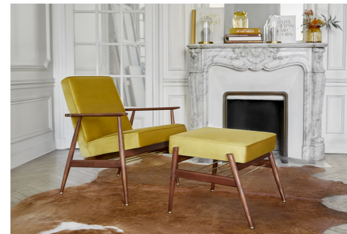
Fox Lounge Chair & Footrest / Fautueil Lounge & Repose Pieds – Shine Velvet Coll. / Mustard