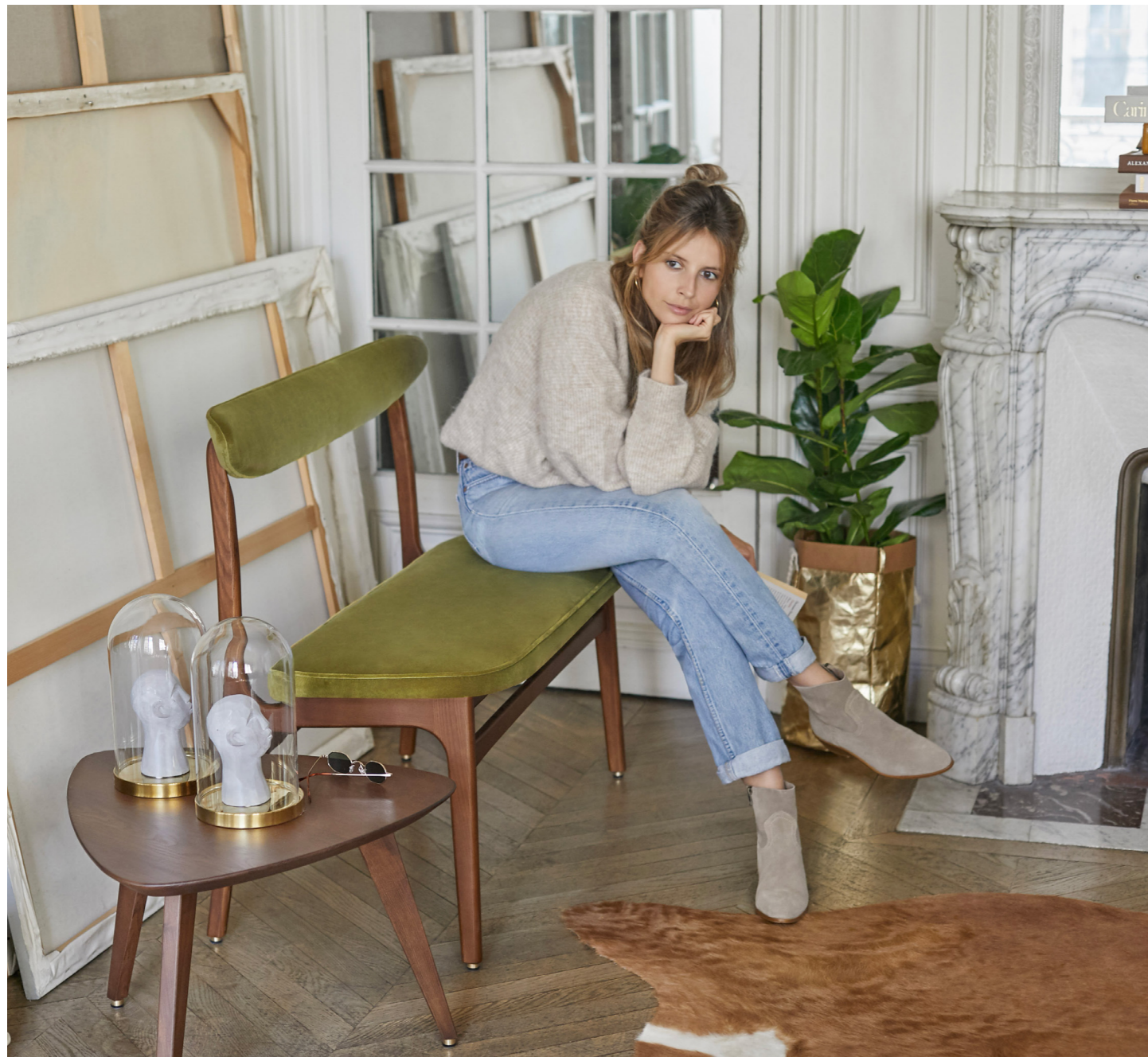
200-190 Bench / Banquette – Velvet Coll. / Olive