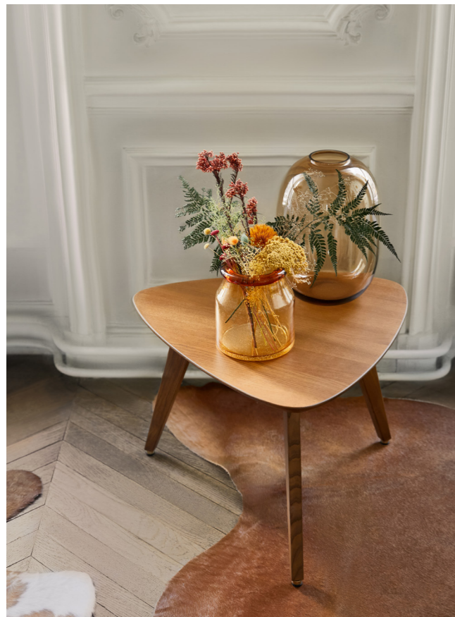
366 Triangle Coffee Table / Table Basse Triangulaire – Oak Wood Dark 03