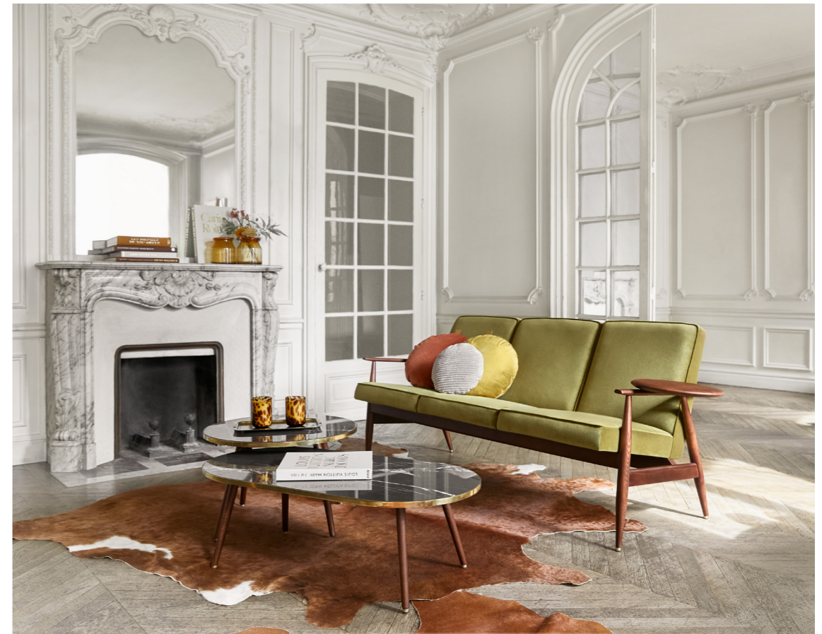
Fox 3-Seater / 3 Places – Velvet Coll. / Olive

Pour rendre le temps passé à la maison encore plus agréable, nous avons introduit d'autres modèles de la série FOX, entre autres, le canapé 3 places. Sa forme élancée en bois ajoutera de la légèreté à l'intérieur et le siège exceptionnellement confortable vous permettra de vous installer facilement, ainsi que deux de vos amis les plus proches. Allongez-vous et naviguez lentement dans vos rêves. Pour ceux d'entre vous qui recherchent des façons inhabituelles de passer du temps à table, le banc 200-190 a été créé. Partagez un repas avec vos proches dans un tout nouveau cadre. Proximité et confort avant tout !