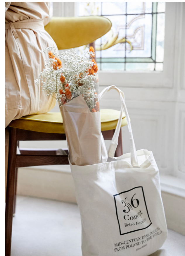
200-190 Chair / Chaise – Shine Velvet Coll. / Mustard

Admirez la nouvelle version du 366 Métal avec ses finitions laiton, dont la forme, plus subtile mais incroyablement captivante lui confère chic et élégance. Cette combinaison unique s'adapte à de nombreuses ambiances d'intérieurs: lofts-contemporains, minimalistes ou maisons rétro. D'autres options de finitions métal permettent d'assortir ce remarquable meuble à une multitude d'environnements, tandis que la version à bascule offrira plus de frivolité et de plaisir. Le 366 Métal, c'est le meilleur choix pour les amateurs de matériaux de haute qualité et de design intemporel. Asseyez-vous et sentez-vous spécial.