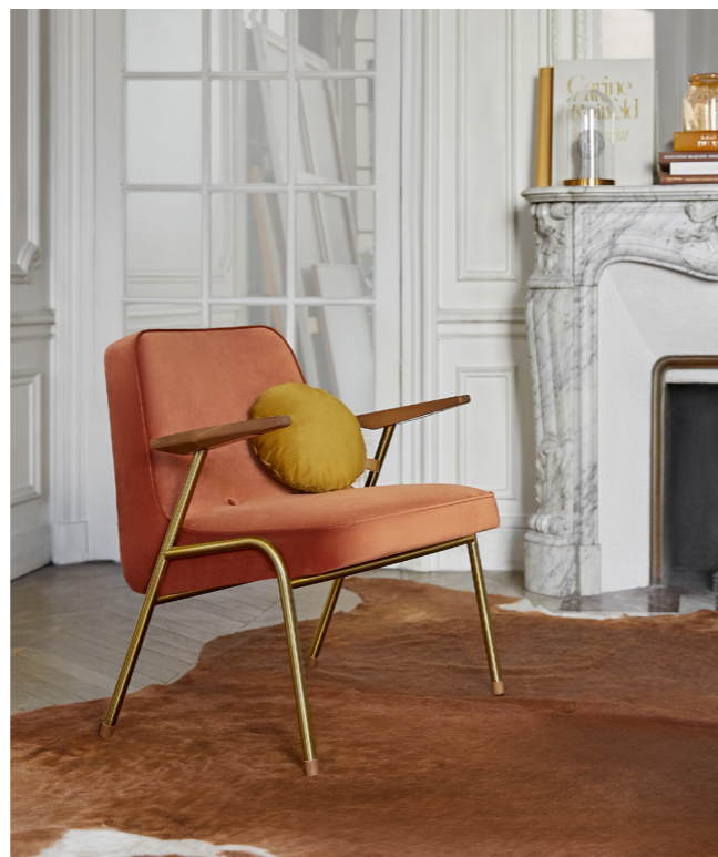
366 Metal Armchair / Fauteuil – Velvet Coll. / Sierra