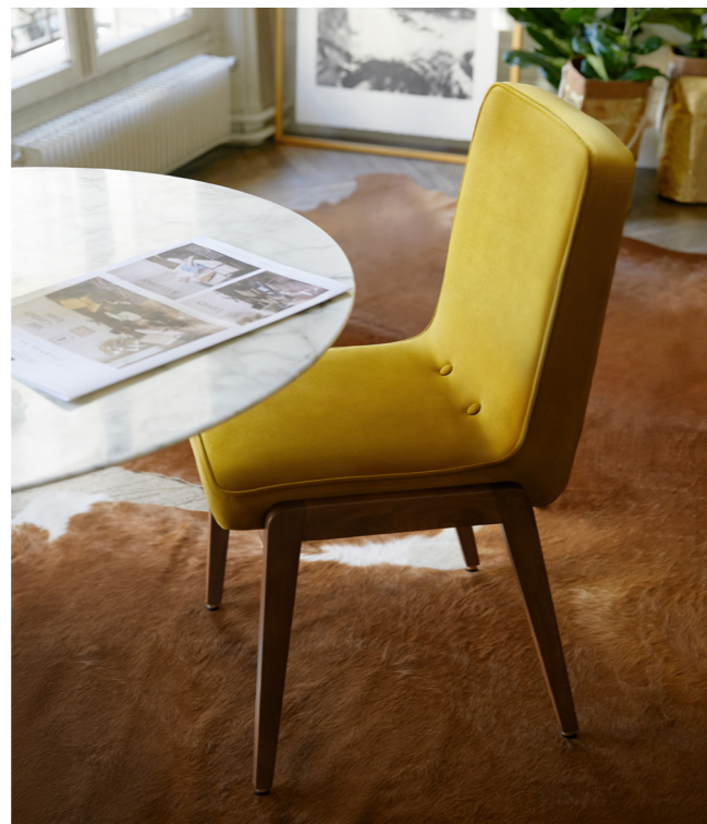
VAR Chair / Chaise – Shine Velvet Coll. / Mustard