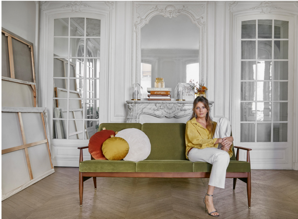
Fox 3-Seater / 3 Places – Velvet Coll. / Olive