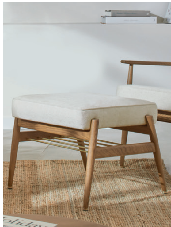
Marble Coll. - White / Frêne 03