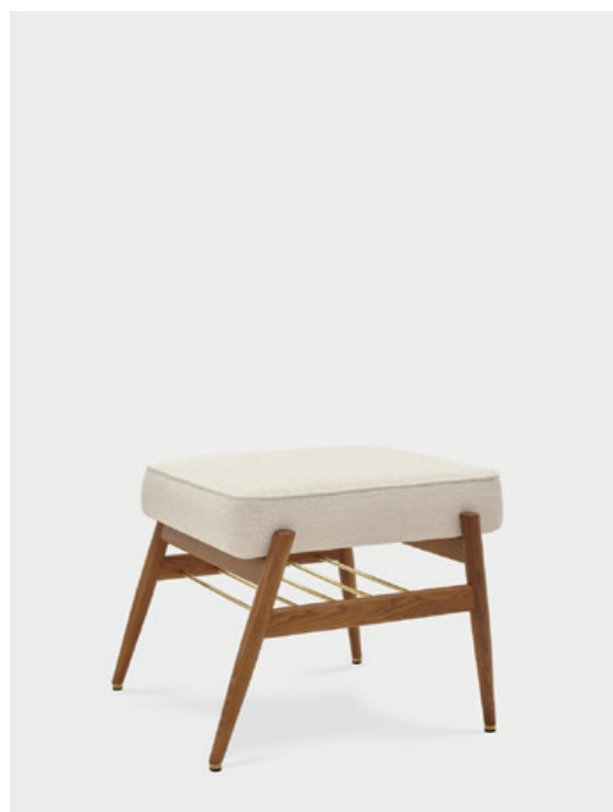
Marble Coll. - White / Frêne 03