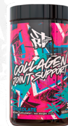
COLLAGEN JOINT SUPPORT