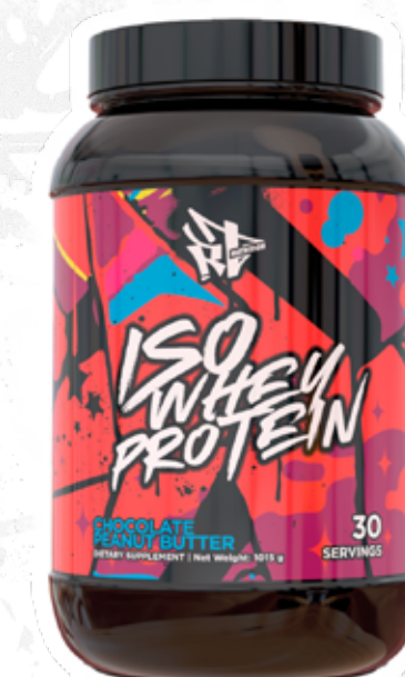
ISO WHEY PROTEIN