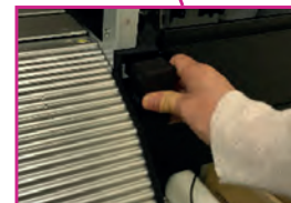
Mécanisme à pression réglable