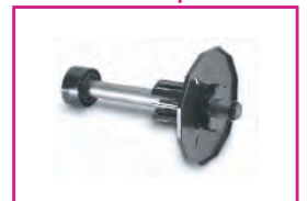
Adaptateur de mandrin amélioré