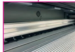
Rail aluminum haute précision