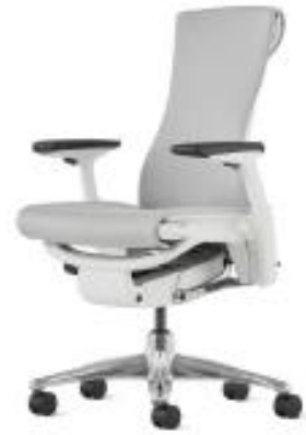
Embody Chair エンボディチェア