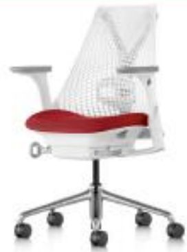
Sayl Chair セイルチェア