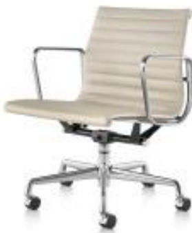
Eames Aluminum Management Chair イームズアルミナム マネジメントチェア