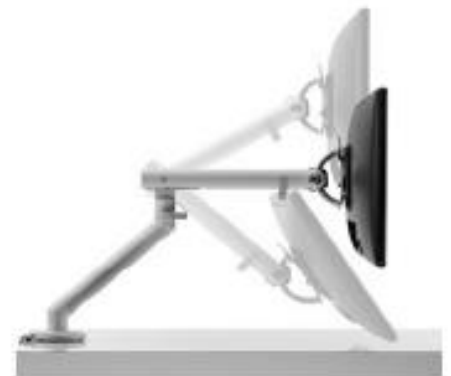
Flo Monitor Arm フロー モニターアーム