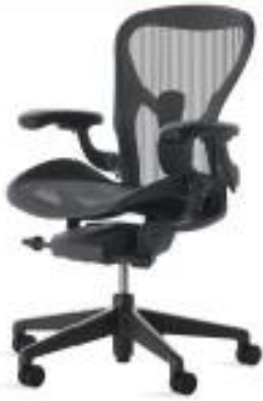
Aeron Chair アーロンチェア