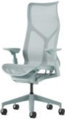
Cosm Chair コズムチェア