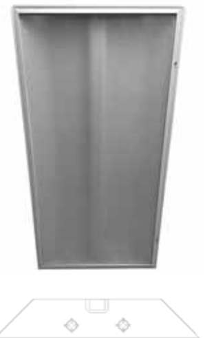
2 TUBES SEV-LU-2T.24