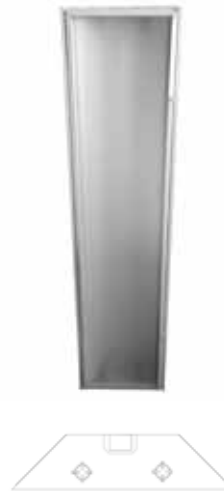
2 TUBES SEV-LU-2T.14