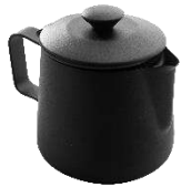
ティーポット ブラック 18-10ステンレス PTFEコーティング

スプーン、フォーク、ナイフ一体型の画期的なデザインで、アミューズや立食パーティ、ケータリングなどで役に立ちます。