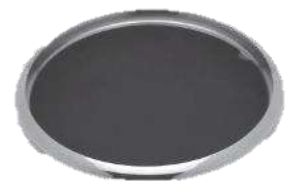
トレイ(シリコンマット付) 品番 7835 底315×幅350×高さ24(mm) ¥50,000