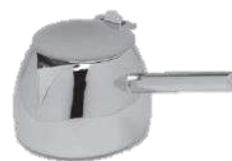
ティーポット 品番 7240 底107×幅99×高さ85(mm) 容量 450ml ¥30,000