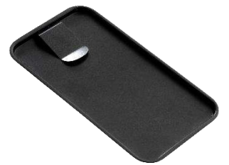
ビルトレイ ブラック 18-10ステンレス PVDコーティング

150ml 品番 9-240B ¥5,500 350ml 品番 9-214B ¥9,000 600ml 品番 9-210B ¥12,000 1L 品番 9-205B ¥15,000