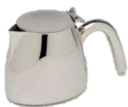
コーヒーポットS 品番 7035 底98×幅77×高さ97(mm) 容量 350ml ¥28,000