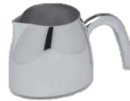
クリーマー(ハンドル付) 品番 7435 底98×幅77×高さ86(mm) 容量 350ml ¥25,000