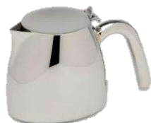
コーヒーポットM 品番 7060 底114×幅91×高さ114(mm) 容量 650ml ¥35,000