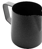
ピッチャー ポット ブラック 18-10ステンレス PTFEコーティング

350ml 品番 9-212B ¥12,000 600ml 品番 9-208B ¥14,000 1L 品番 9-206B ¥17,000