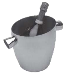
シャンパンクーラー 品番 7908 底213×幅171×高さ206(mm) 容量 5L ¥50,000