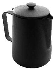
コーヒーポット ブラック 18-10ステンレス PTFEコーティング

350ml 品番 9-212B ¥12,000 600ml 品番 9-208B ¥14,000 1L 品番 9-206B ¥17,000