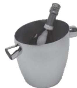
シャンパンクーラー

品番 7435 底98×幅77×高さ86(mm) 容量 350ml ¥25,000