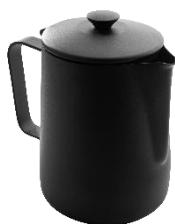
コーヒーポット ブラック 18-10ステンレス PTFEコーティング

350ml 品番 9-212B ¥12,000 600ml 品番 9-208B ¥14,000 1L 品番 9-206B ¥17,000