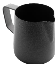
ピッチャー ポット ブラック 18-10ステンレス PTFEコーティング

350ml 品番 9-212B ¥12,000 600ml 品番 9-208B ¥14,000 1L 品番 9-206B ¥17,000