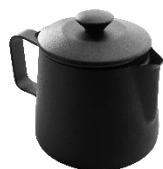
ティーポット ブラック 18-10ステンレス PTFEコーティング

スプーン、フォーク、ナイフ一体型の画期的なデザインで、アミューズや立食パーティ、ケータリングなどで役に立ちます。