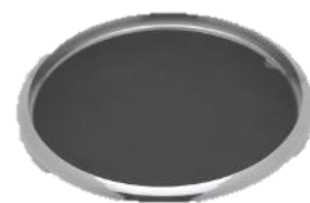
トレイ(シリコンマット付)

品番 7240 底107×幅99×高さ85(mm) 容量 450ml ¥30,000