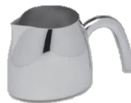
クリーマー(ハンドル付)

品番 7415 底72×幅61×高さ66(mm) 容量 180ml ¥13,000