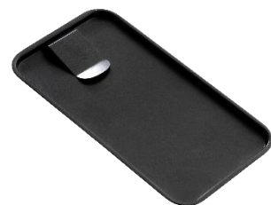
ビルトレイ ブラック 18-10ステンレス PVDコーティング

150ml 品番 9-240B ¥5,500 350ml 品番 9-214B ¥9,000 600ml 品番 9-210B ¥12,000 1L 品番 9-205B ¥15,000