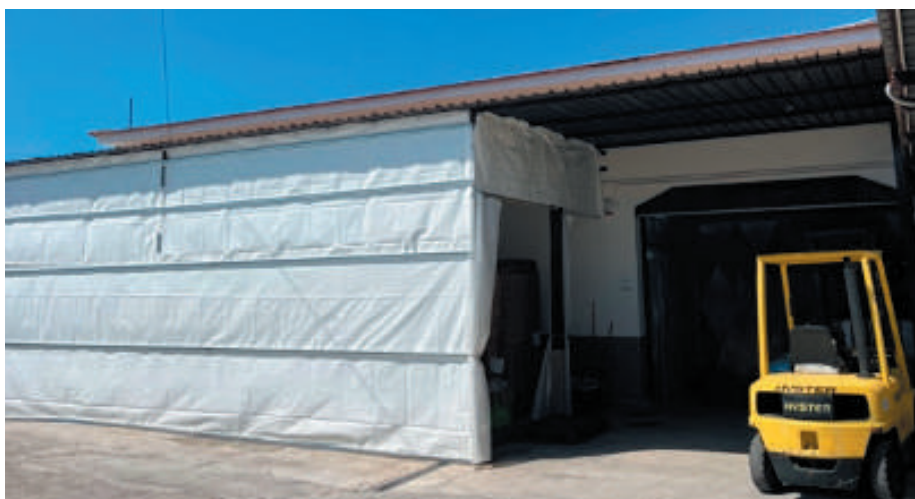
IL NOSTRO STABILIMENTO OCCUPA UNA SUPERFICIE DI 1.500MQ