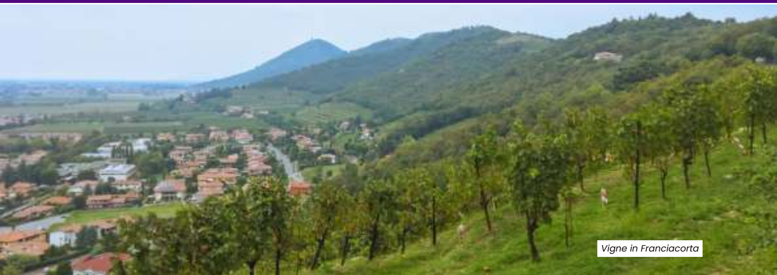
Vigne in Franciacorta