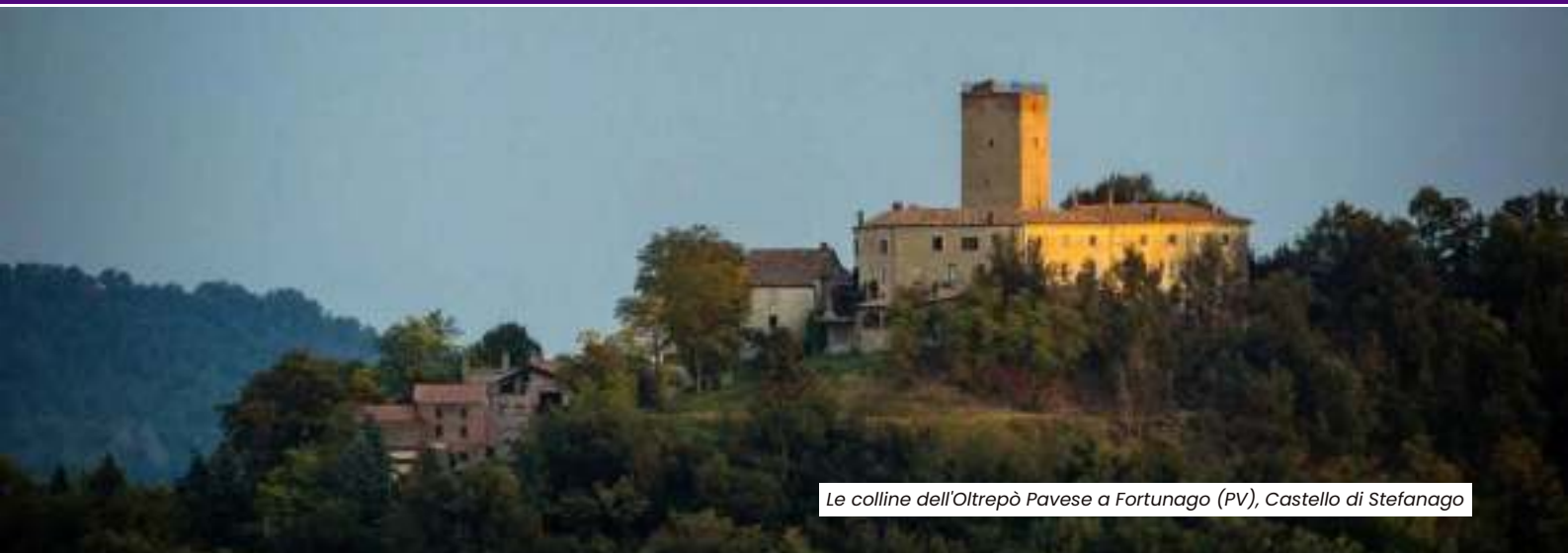
Le colline dell'Oltrepò Pavese a Fortunago (PV), Castello di Stefanago