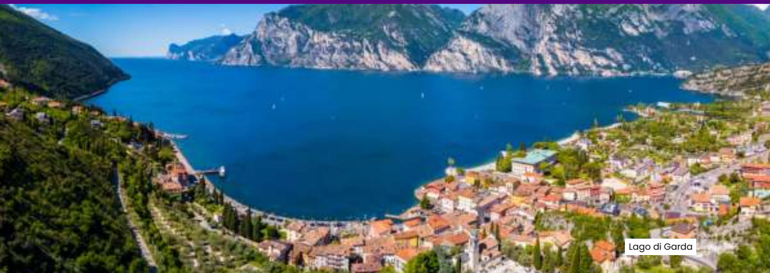
Lago di Garda