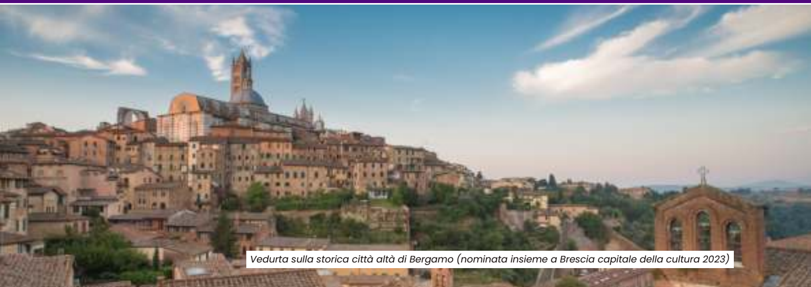
Veduta sulla storica città alta di Bergamo (nominata insieme a Brescia capitale della cultura 2023)