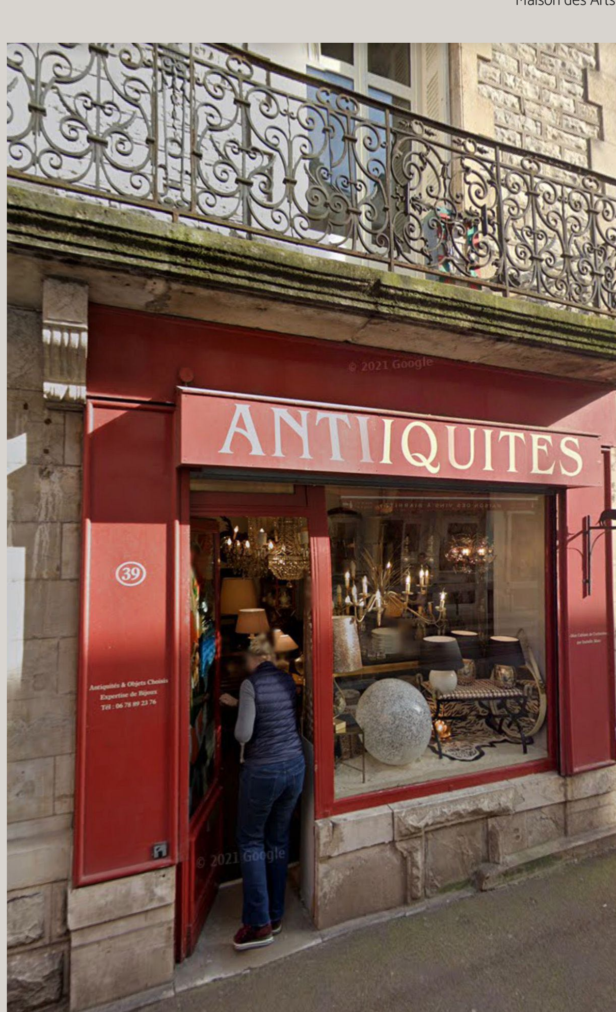
Isabelle Marc Antiquités

Para los amantes del Golf, Biarritz es un paraíso. Hay muchas opciones como Bassussarry , Golf del Faro , Arcangues , Ibarriz , Chiberta ... todos son maravillosos. Unos más céntricos y otros más a las afueras.