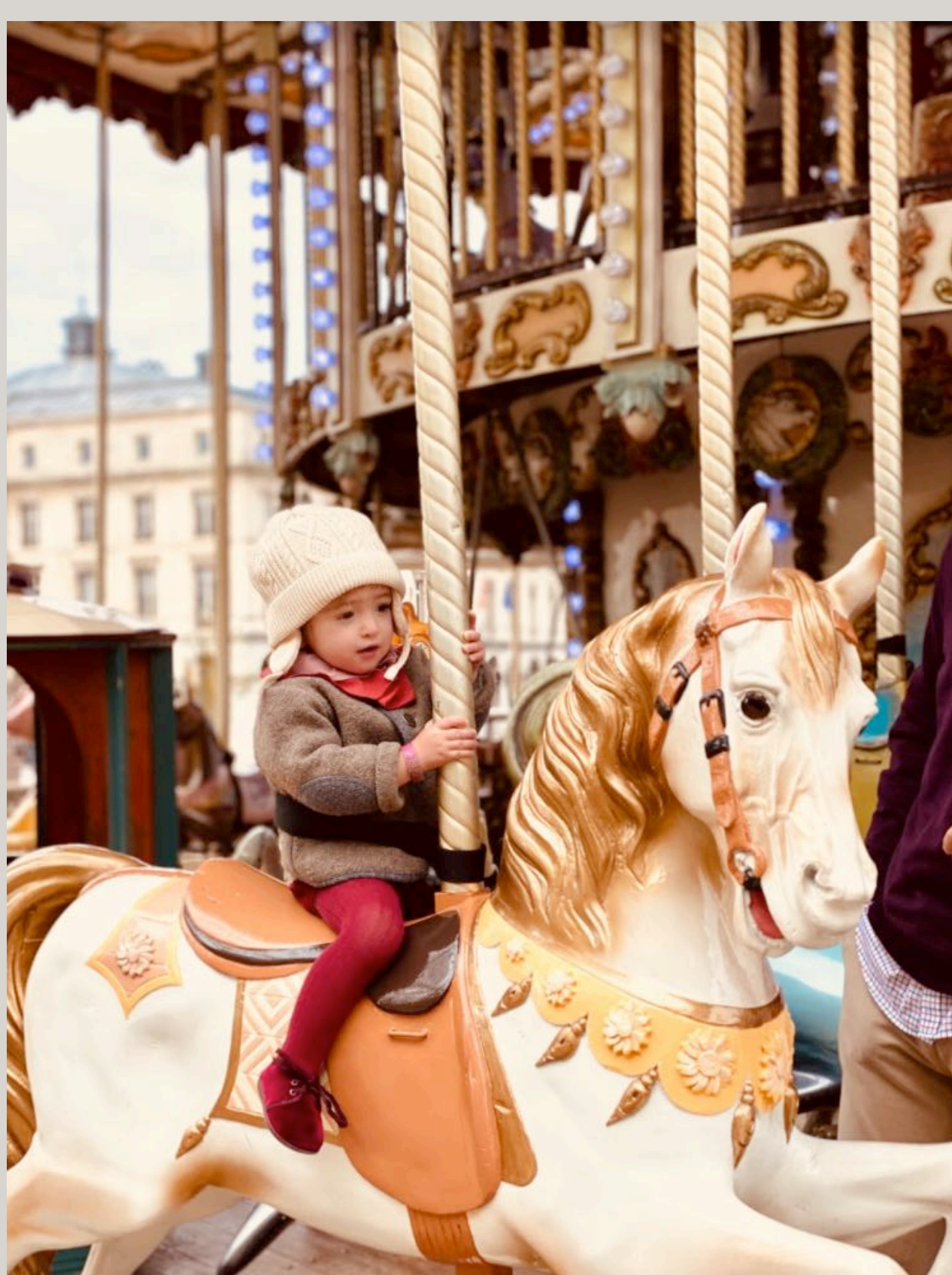
Tiovivo de la Grande Plage