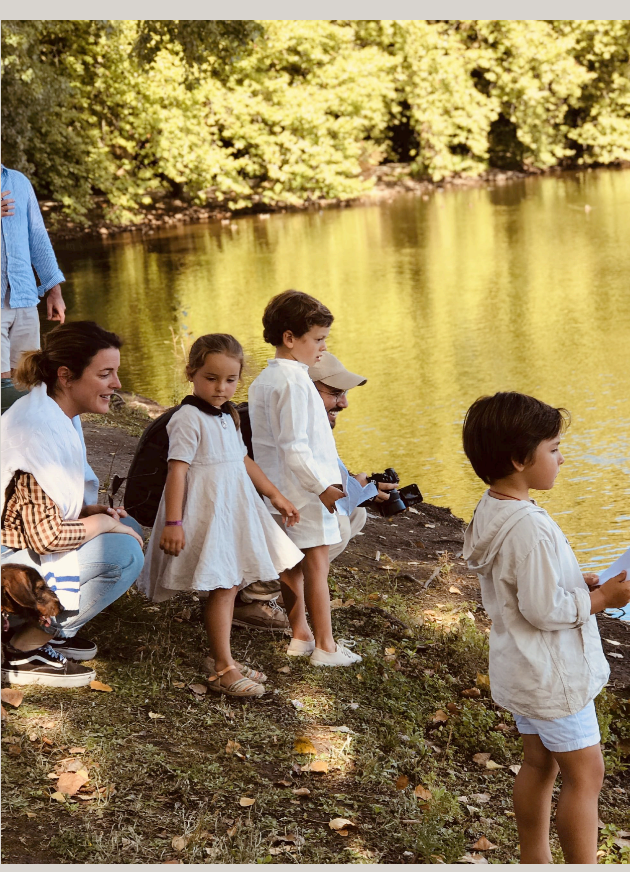
El Lac Marion