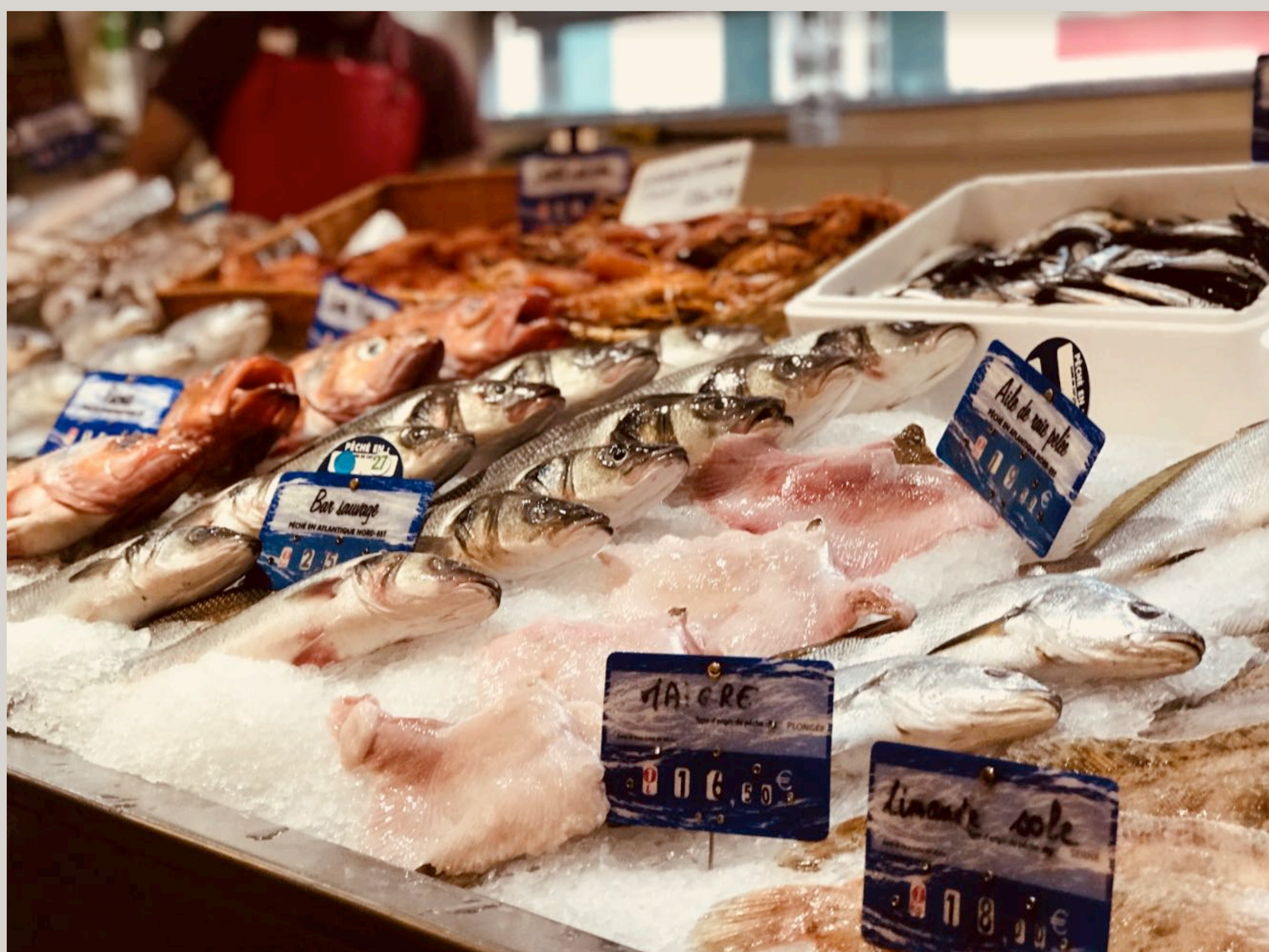
El mercado de les Halles

Para rematar la noche y tomar una copa a “la española”, con hielos y bien servida, bajamos al Bar de la Plage , al lado del Casino .