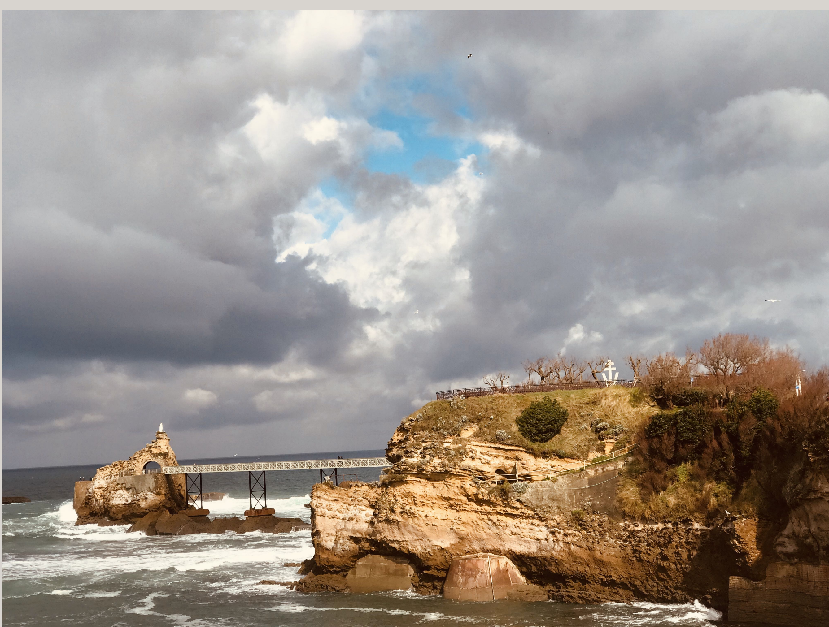
Virgen de la Roca