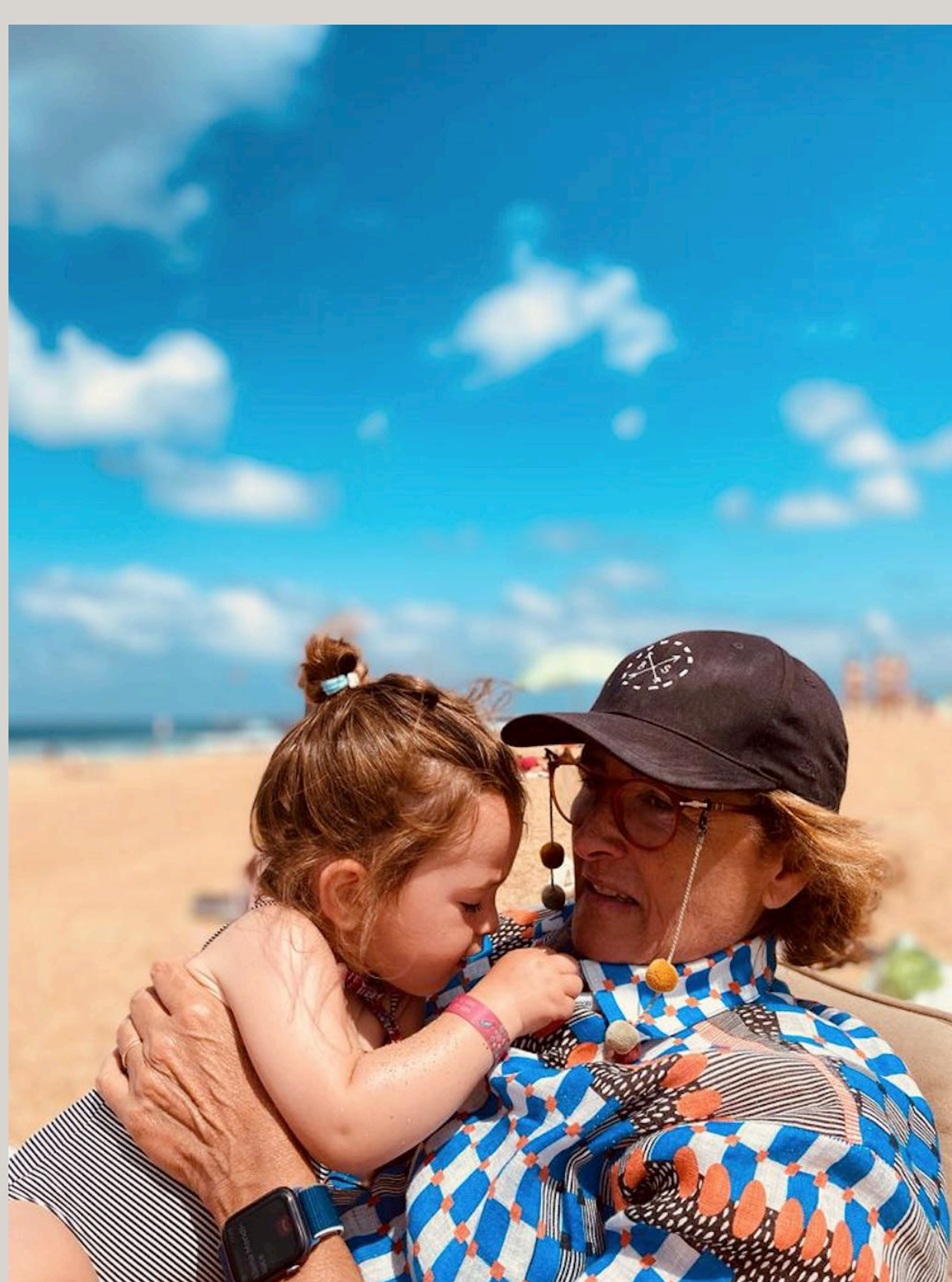
Playa la Madrague, Anglet

En el otro lado, hacia el sur, las otras playas que nos acercan hacia España también nos encantan y son las de Ilbarritz y la Milady . Esta última, tiene un parque para niños al que íbamos de pequeños y que ahora también volvemos a frecuentar con nuestros niños. No olvidéis revisar las mareas y si os cuadra bien ir mejor en marea baja (no hay color).