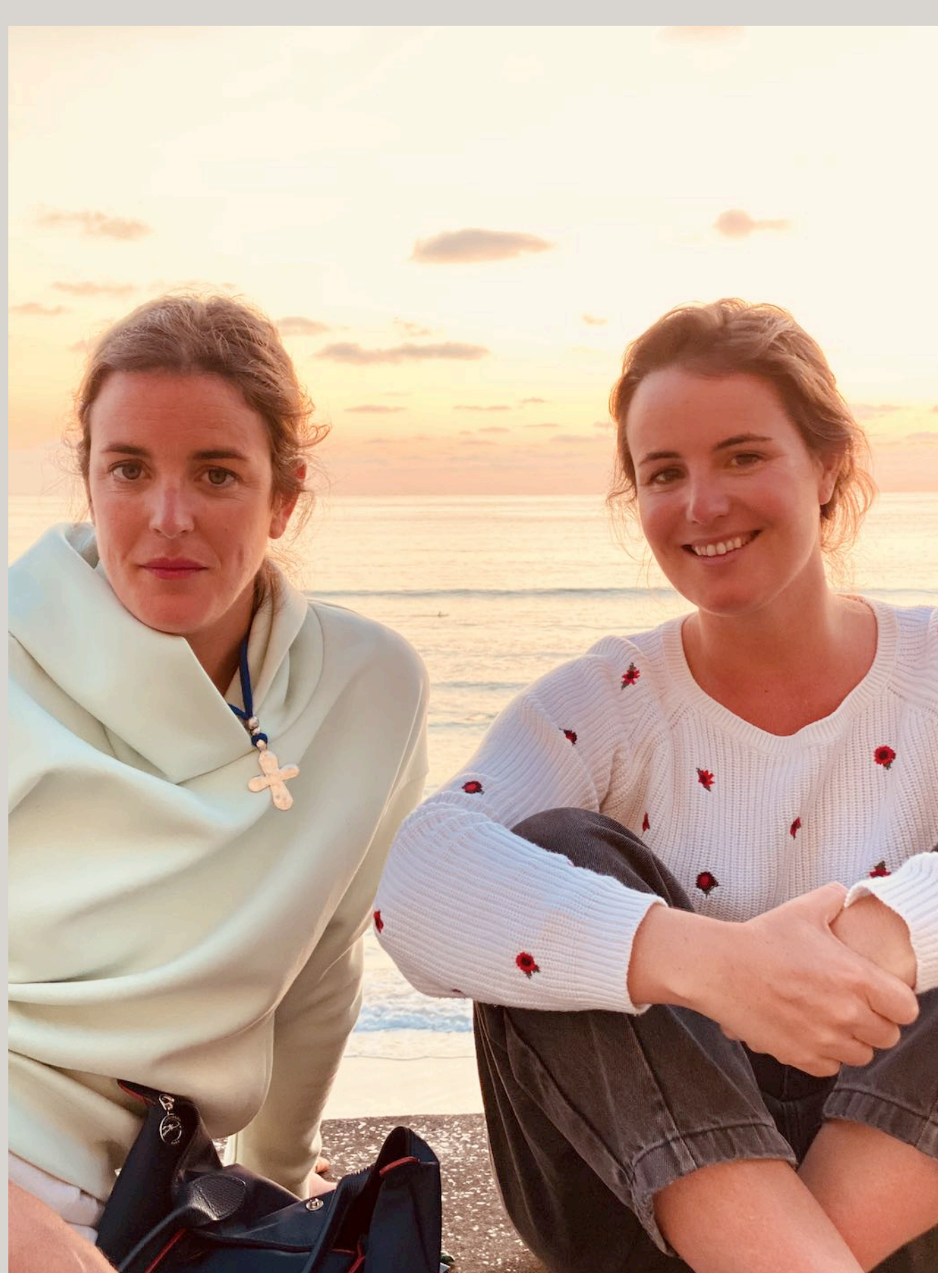
Côte des Basques

El mercado de Les Halles es un imprescindible para comprar un buen queso, ostras o un buen foie. Puedes comprar las cosas y llevártelas a la playa pero puedes también picar en el mismo mercado ya que tienen mesas altas en las esquinas.