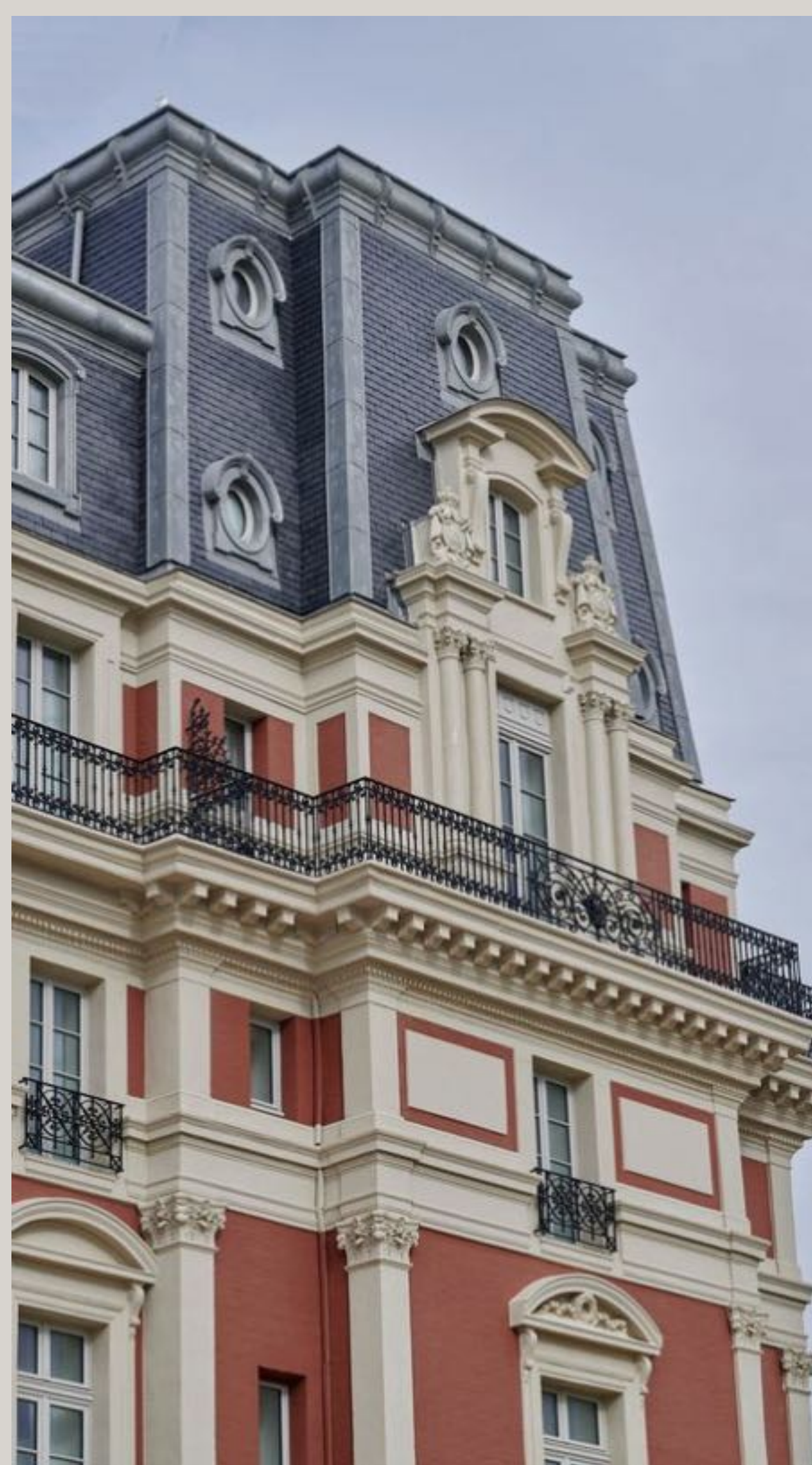
Hôtel du Palais