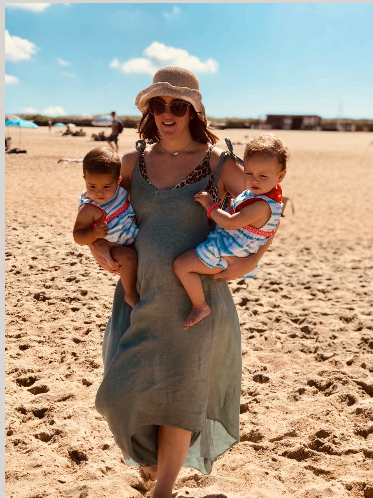
Playa la Madrague, Anglet