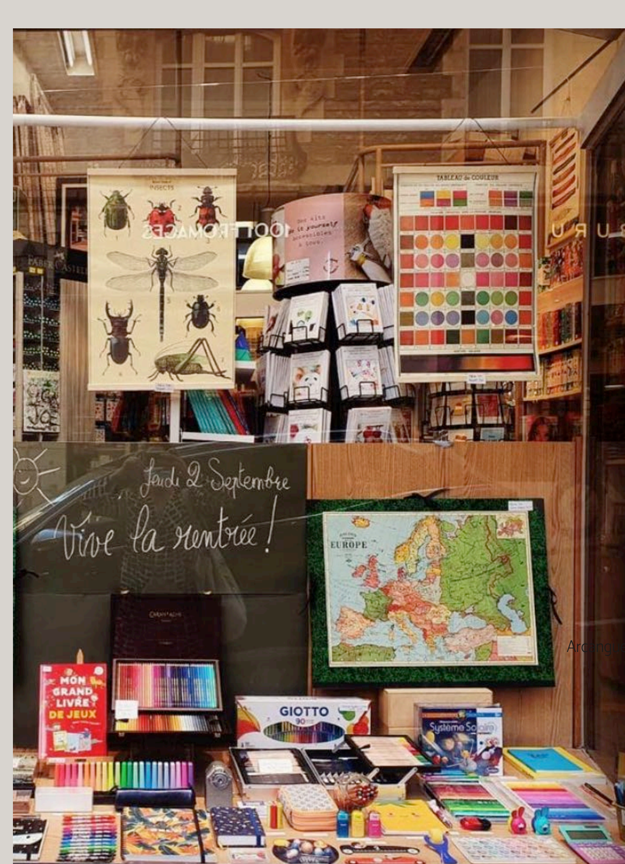
Maison des Arts

La Maison des Arts si queremos hacer manualidades con los niños aunque también vale para disfrutar mirando de todo lo que tienen.