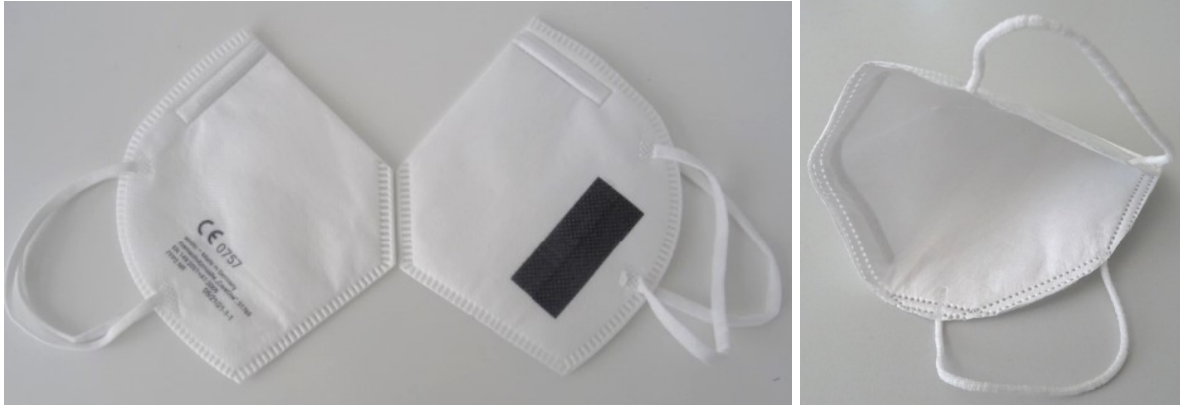
01769 Atemschutzmaske/ Respiratory mask „CareOne“ FFP2 NR

dass folgender Artikel/ the following article: