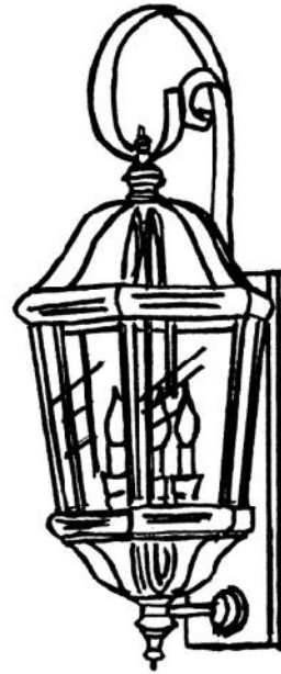
Drawing 1 - Strap Detail