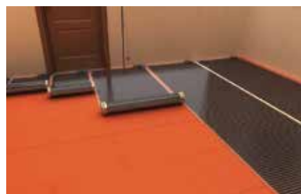
2 Instalar la lámina Ecofilm sobre el aislante térmico.