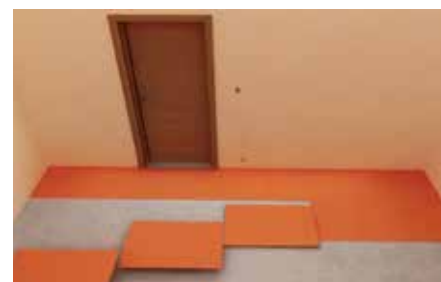
1 Montar aislante térmico Silent Floor sobre la losa.