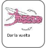
Dar la vuelta