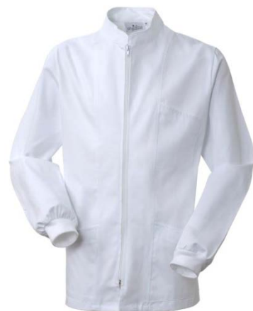
02 – BIANCO