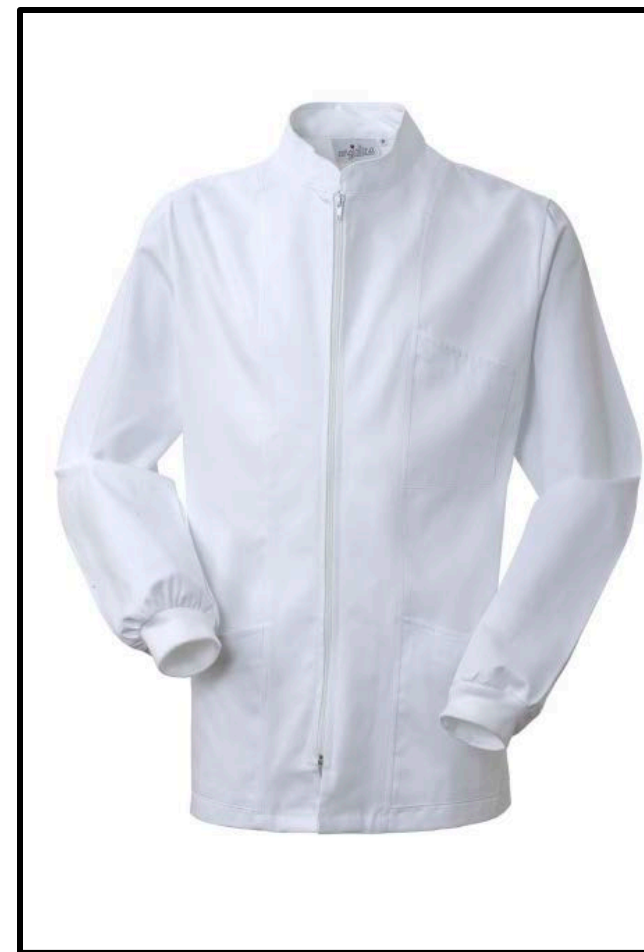
02 – BIANCO