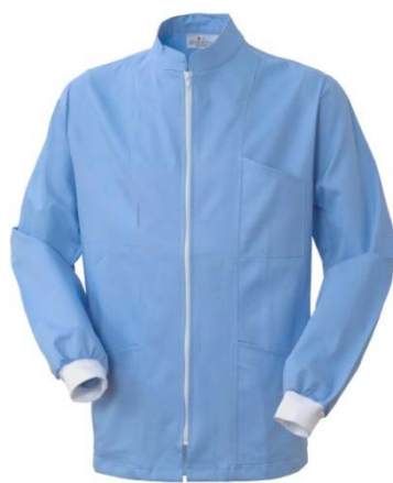
24 – CELESTE