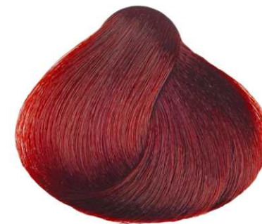
BIONDO ROSSO INTENSO DEEP RED BLONDE RUBIO ROJO INTENSO BLOND ROUGE INTENSE ΞΑΝΘΟ ΕΝΤΟΝΟ ΚΟΚΚΙΝΟ