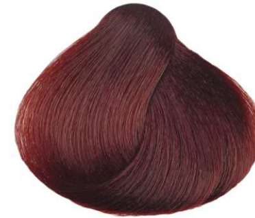
ROSSO VENEZIANO VENETIAN RED ROJO VENECIANO ROUGE VENETIEN ΚΟΚΚΙΝΟ ΒΕΝΕΤΙΑΝΟ