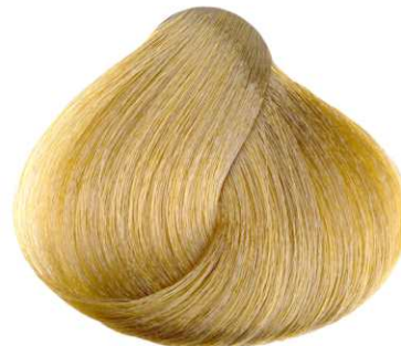
PLATINO EXTRA DORATO EXTRA-GOLDEN PLATINUM PLATINO EXTRA-DORADO BLOND PLATINE EXTRA DORÉ ΠΛΑΤΙΝΕ EXTRA - ΧΡΥΣΟ