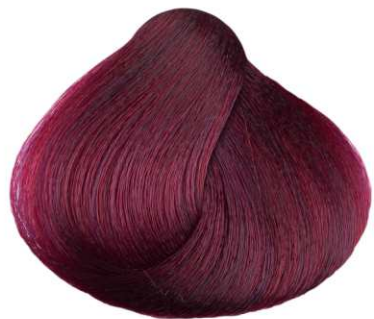
BIONDO IRISÉ VIOLET BLONDE RUBIO IRISADO BLOND IRISÉ ΙΩΔΕΣ ΞΑΝΘΟ