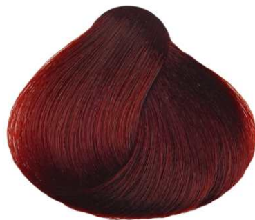
CASTANO CHIARO ROSSO INTENSO DEEP LIGHT RED BROWN CASTAÑO CLARO ROJO INTENSO CHÂTAİN CLAIR ROUGE INTENSE ΚΑΣΤΑΝΟ ΑΝΟΙΚΤΟ ΕΝΤΟΝΟ ΚΟΚΚΙΝΟ