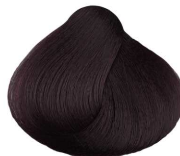
NERO VIOLA VIOLET BLACK NOIR VIOLET NEGRO VIOLETA IΩΔEZ MAYPO