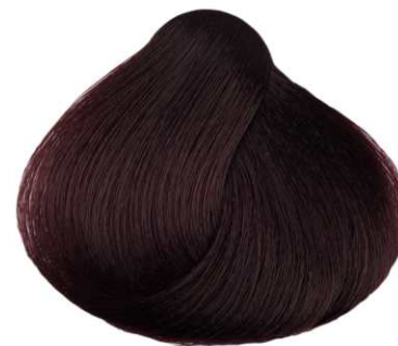
CASTANO CHIARO MOGANO LIGHT MAHOGANY BROWN CASTANO CLARO CAOBA CHÂTAIN CLAIR ACAJOU KAZTANO ANOIKTO AKAZOY