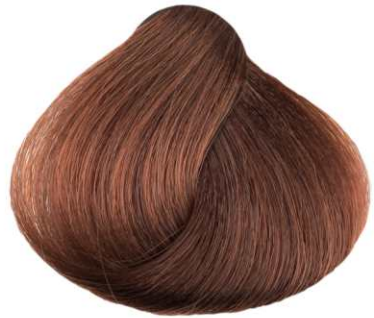
BIONDO RAME COPPER BLONDE RUBIO COBRIZO BLOND CUIVRE ΞΑΝΘΟ ΧΑΛΚΙΝΟ