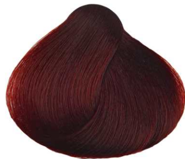
CASTANO ROSSO INTENSO DEEP RED BROWN CASTAÑO ROJO INTENSO CHÂTAİN ROUGE INTENSE ΚΑΣΤΑΝΟ ΕΝΤΟΝΟ ΚΟΚΚΙΝΟ