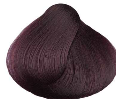
CASTANO IRISÉ VIOLET BROWN CASTANO IRISADO CHÂTAIN IRISÉ IΩΔEZ KAZTANO