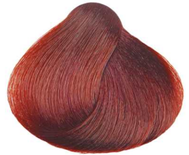
BIONDO CHIARO ROSSO LIGHT RED BLONDE RUBIO CLARO ROJO BLOND CLAIR ROUGE ΞΑΝΘΟ ΑΝΟΙΚΤΟ ΚΟΚΚΙΝΟ