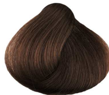
CASTANO CHIARO RAME LIGHT COPPER BROWN CASTANO CLARO COBRIZO CHÂTAIN CLAIR CUIVRE KAZTANO ANOIKTO XA/KINO