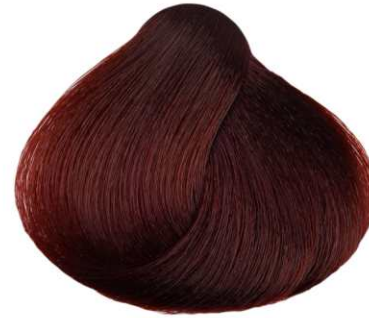
BIONDO SCURO MOGANO RAMATO COPPER MAHOGANY DARK BLONDE RUBIO OSCURO CAOBA COBRIZO BLOND FONCÉ CUIVRE ACAJOU ΞΑΝΘΟ ΣΚΟΥΡΟ ΑΚΑΖΟΥ ΧΑΛΚΙΝΟ