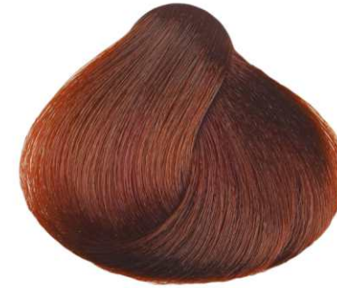
BIONDO RAME DORATO COPPER GOLDEN BLONDE RUBIO COBRIZO DORADO BLOND CUIVRE DORÉ ΞΑΝΘΟ ΧΑΛΚΙΝΟ ΧΡΥΣΑΦΙ