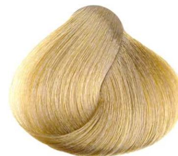
SUPER SCHIARENTE DORATO GOLDEN SUPER LIGHTENER SUPER ACLARADOR DORADO SUPER DÉCOLORANT DORÉ ΞΑΝΟΙΣΤΙΚΟ ΧΡΥΣΑΦΙ