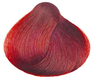
BIONDO CHIARO ROSSO INTENSO LIGHT DEEP RED BLONDE RUBIO CLARO ROJO INTENSO BLOND CLAIR ROUGE INTENSE ΞΑΝΘΟ ΑΝΟΙΚΤΟ ΕΝΤΟΝΟ ΚΟΚΚΙΝΟ