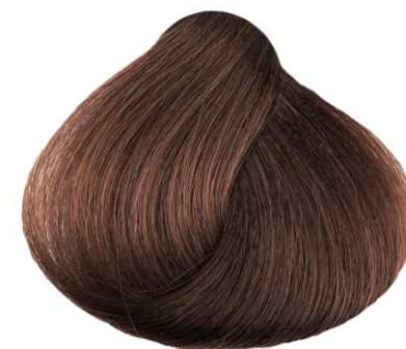
BIONDO SCURO RAME DARK COPPER BLONDE RUBIO OSCURO COBRIZO BLOND FONCÉ CUIVRE EANGO ZKOYPO XA/KINO