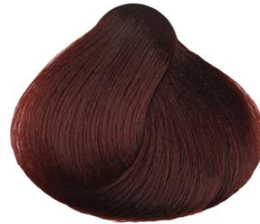
BIONDO SCURO ROSSO DARK RED BLONDE RUBIO OSCURO ROJO BLOND FONCÉ ROUGE ΞΑΝΘΟ ΣΚΟΥΡΟ ΚΟΚΚΙΝΟ