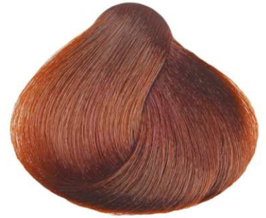
BIONDO CHIARO RAME DORATO LIGHT COPPER GOLDEN BLONDE RUBIO CLARO COBRIZO DORADO BLOND CLAIR CUIVRE DORÉ ΞΑΝΘΟ ΑΝΟΙΚΤΟ ΧΑΛΚΙΝΟ ΧΡΥΣΑΦΙ