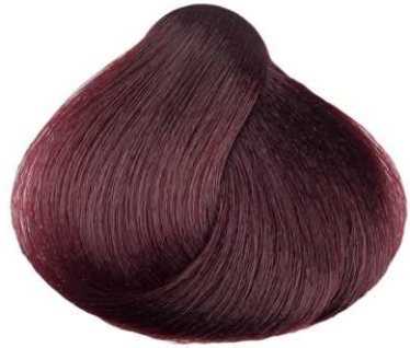
BIONDO MOGANO MAHOGANY BLONDE RUBIO CAOBA BLOND ACAJOU ΞΑΝΘΟ ΑΚΑΖΟΥ