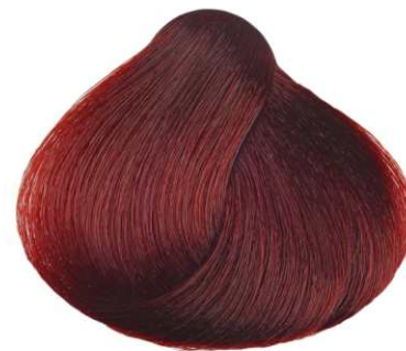
BIONDO SCURO ROSSO INTENSO DARK DEEP RED BLONDE RUBIO OSCURO ROJO INTENSO BLOND FONCÉ ROUGE INTENSE ΞΑΝΘΟ ΣΚΟΥΡΟ ΕΝΤΟΝΟ ΚΟΚΚΙΝΟ