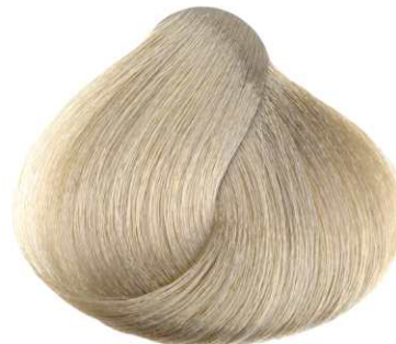
PLATINO CENERE ASH PLATINUM PLATINO CENIZA BLOND PLATINE CENDRE ΠΛΑΤΙΝΕ ΣΑΝΤΡΕ