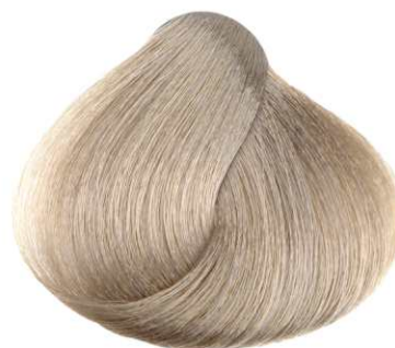
SUPER SCHIARENTE CENERE ASH SUPER LIGHTENER SUPER ACLARADOR CENIZA SUPER DÉCOLORANT CENDRÉ ΞΑΝΟΙΣΤΙΚΟ ΣΑΝΤΡΕ