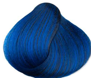
Blu BLUE AZUL BLEU