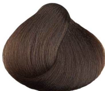
5.032 CIOCCOLATO MEDIO MEDIUM CHOCOLATE CHOCOLATE MEDIO CHOCOLAT MOYEN