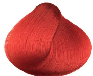
Extra Rosso EXTRA RED ROJO EXTRA EXTRA ROUGE