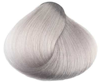
Perla PEARL PERLE