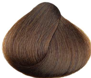
7.34 CANNELLA CINNAMON CANELA CANNELLE