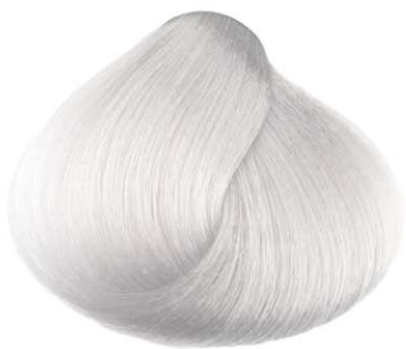
000 NEUTRO NEUTRAL NEUTRO NEUTRE