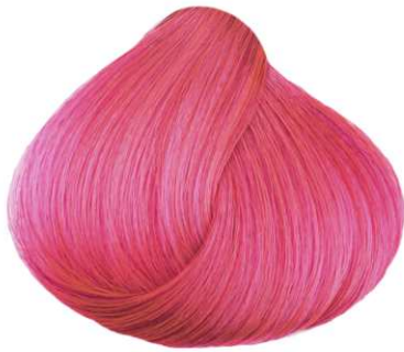
Rosa PINK ROSE