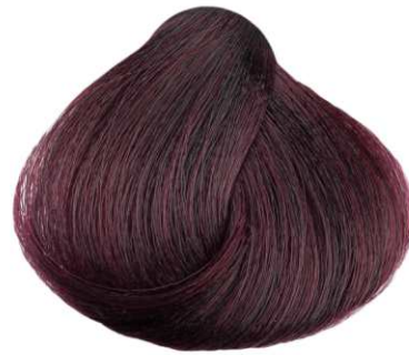
4.26 PRUGNA PLUM CIRUELA PRUNE