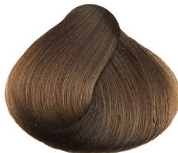
7.32 TABACCO TOBACCO TABACO TABAC