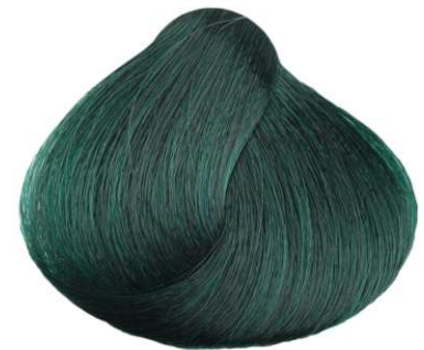
Verde GREEN VERT