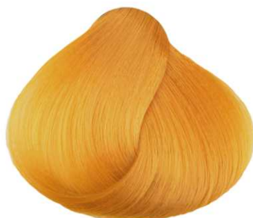
Giallo YELLOW AMARILLO JAUNE