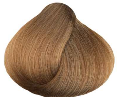
8.32 TABACCO CHIARO LIGHT TOBACCO TABACO CLARO TABAC CLAIR