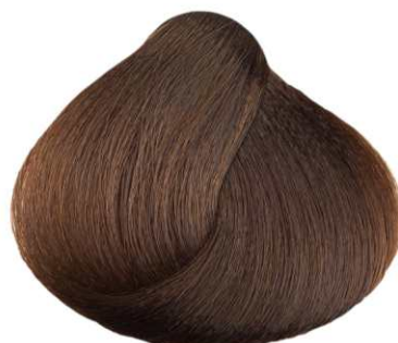
6.032 CIOCCOLATO CHIARO LIGHT CHOCOLATE CHOCOLATE CLARO CHOCOLAT CLAIR