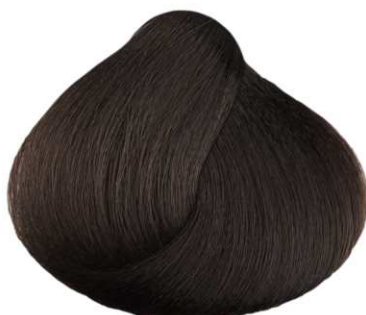
4.032 CIOCCOLATO SCURO DARK CHOCOLATE CHOCOLATE OSCURO CHOCOLAT FONCÉ