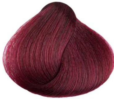
Fucsia FUCHSIA MAGENTA