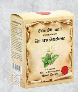
PREPARATO PER AMARO 90 g

PER CONTATTI, INFORMAZIONI, ORDINI FOR CONTACTS, INFORMATION AND ORDERS