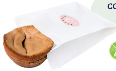
COULANT (80g - Caja 12 uds)