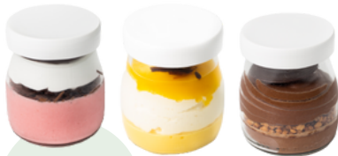
MOUSSE VEGANOS ❄️ (100g - Caja 12 uds)