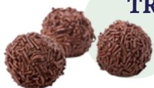
TRUFA CHOCOLATE ❄️ SIN GLUTEN (15 g - Bolsa 50 uds - Caja 9 bolsas)