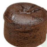
COULANT CHOCOLATE ❄️ 1224 SIN GLUTEN (90 g - Caja 20 uds)