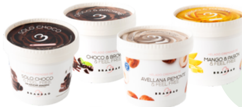
HELADOS VEGANOS ❄️ (120g- Caja 12 uds)