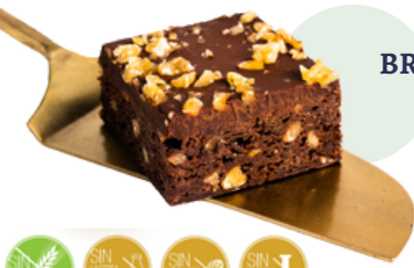
BROWNIE (85 g - Caja 12 uds)