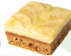
IDUNN VEGANO ❄️ (80g - Caja 12 uds)