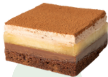
ASHA VEGANO ❄️ (85g- Caja 12 uds)